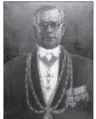
Γ. Φωτεινός. Άφησε εποχή κι αυτός δευσης, είτε έμμεσα, προσφέροντας το εφαλτήριο για την εισαγωγή των αποφοίτων στην τριτοβάθμια εκπαίδευση. Να σημειώσω, ότι την γενικότερη επιρροή του Γυμνασίου στην κοινωνία των Κυθηρίων, κατά τα 100

τέκπσαν κατά την διάρκεια της τελευταίας τριακονταετίας πριν από το κλείσιμο του 20ου αιώνα. Είναι όμως επίσης πολύ αξιοσημείωτο, ότι μετά την εξίσωση των δύο φύλων στο επίπεδο της τριτοβάθμιας εκπαίδευσης, που επήλθε στο τέλος της τριακονταετίας (2001), στην πρώτη δεκαετία του