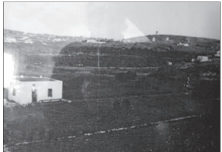
Το κτήριο του Πιέρου αριστερά ήταν ένα από τα λίγα στο Λειβάδι τη δεκαετία του 1920