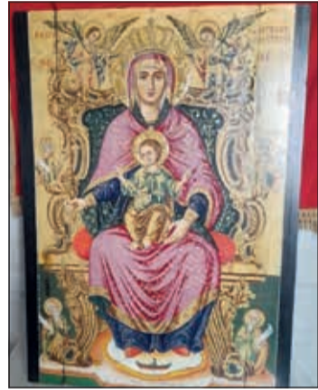
Η εικόνα της «Φρατσιώτισσας»

κατοίκους τους, για να «βρουν το μίστορά τους», όταν οι αγανακτισμένοι από την άρνηση της Βενετικής φρουράς να αντιμετωπίσει τους εισβολείς, κάτοικοι του νησιού, συναντήθηκαν στα Μπτάτα με όσα όπλα βρήκαν πρόχειρα, επιτέθηκαν στα πλοία και τα λεηλάτησαν εκδιώκοντας τους Καταλανούς. Αυτοί απευθύνθηκαν στον βασιλιά τους, που με τη σειρά του διαμαρτυρήθηκε στο Δόγη της Βενετίας, ο οποίος διέταξε ανακρίσεις. Αυτές έγιναν στο ναό του Αγίου Νικολάου στα Καλύβια, πολύ κοντά στα Φράτσια, από τον Δούκα της Κρήτης. Ανάμεσα στα χωριά που λεηλάτησαν οι εισβολείς ήταν και