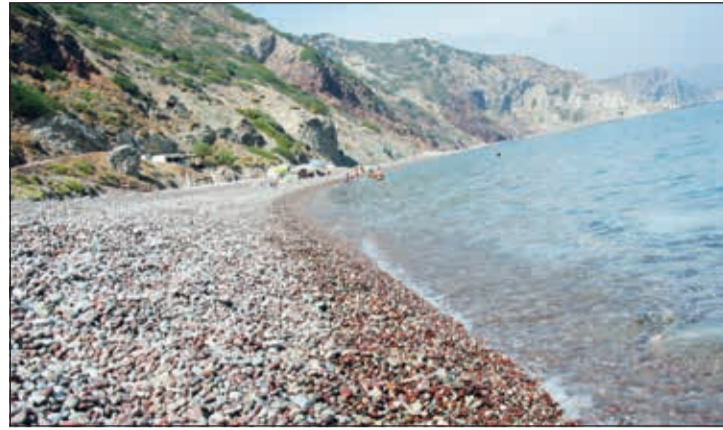
Η παραλία της Φυρής Άμμου (Κάλαμος). Θα είναι πιο προσπύ του χρόνου.

τείται παράκαμψη χιλιομέτρων, είχε ξεκινήσει τον Οκτώβριο, αλλά λίγο αργότερα ήρθε εντολή διακοπής των εργασιών από την Αρχαιολογική υπη-