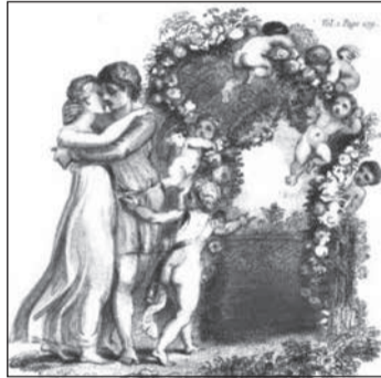
Το ερωτικό σμιξιμο του Ναύτη με την Μελίνδα.

γράφει τα βιβλία του. Ξεκίνησε να γράφει το 1752 και επηρεασμένος από τον Θεόκριτο άρχισε με το ειδύλ-