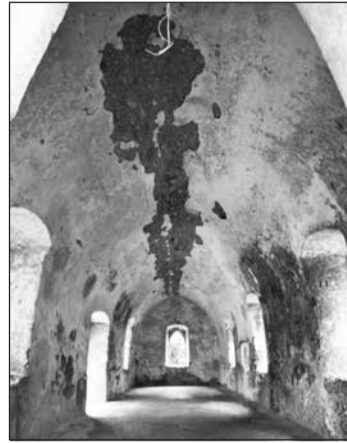
Το εσωτερικό του σχολείου της αγγλοκρατίας στην Κάτω Χώρα Μυλοποτάμου.

όμως από τα μεγαλύτερα, όπως τα αρρένων του Ποταμού, των Λογοθεπτανικών και των Αρωναδικών, οι απώλειες είναι μεγάλες, αντίστοιχα, 32%, 55% και 53%. Η κατάσταση αυτή συνεχίζεται και εντείνεται στην