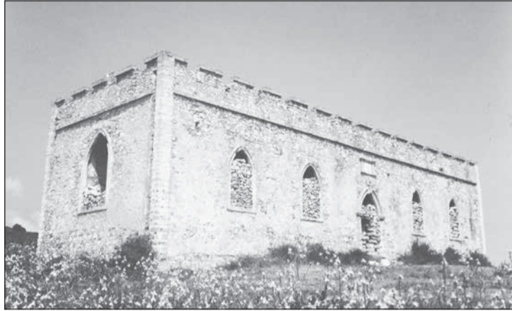
Το πλέον εμβληματικό σχολείο της αγγλοκρατίας. Η Μπλαπιδέα στο Λειβάδι.

Η κατ' αυτόν τον τρόπον τμηματική ίδρυση του Γυμνασίου έγινε χωρίς καμία κρατική χρηματοδότηση, και με την προϋπόθεση ότι η Κοινότητα Κυθήρων θα εξεύρει το κτίριο για την στέγασή του και τα απαιτούμενα έπιπλα και εφόδια για την λειτουργία του, όπως και έγινε. Εκτός από το