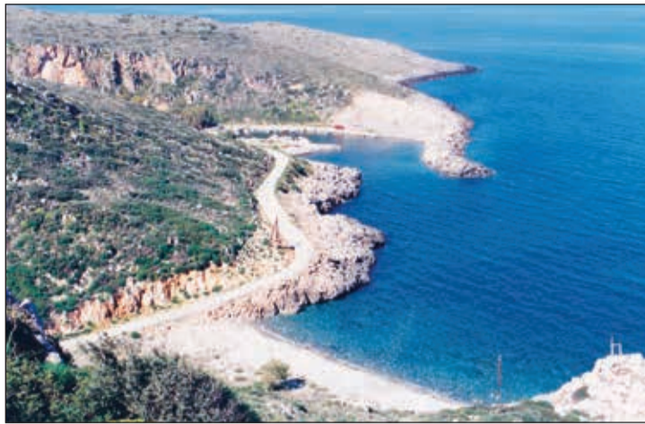
Το μικρό λιμανάκι της Αγίας Πατρίκις. Εδώ θα τοποθετηθούν οι μονάδες αφαλάτωσης της Αγίας Πελαγίας.

Σε ό,τι αφορά τον οικισμό της Αγ. Πελαγίας , θα υδροδοτείται πλέον από 2 μονάδες αφαλάτωσης δυναμικότητας 600 κυβικών ημερησίως, συμπληρωματικά προς το δίκτυο των γεωτρήσεων. Επιπλέον, σε συνδυασμό με το μεγάλο έργο του νέου δικτύου ύδρευσης του οικισμού, διασφαλίζεται επάρκεια και ποιότητα νερού τουλάχιστον για τα επόμενα 25 χρόνια , στον πλέον τουριστικό οικισμό των Κυθέρων που διαθέτει τις περισσότερες κλίνες (συγκεντρικά) και ως εκ τούτου έχει