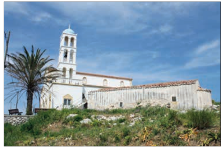
Η Παναγία Ελεούσα. Πίσω ο νέος ναός, εμπρός ο παλιός. Αυτή είναι η «Φρατσιώτισσα» των πηγών.

Όσον αφορά την ετυμολογία της λ. Φράτσια, θεωρούμε πιθανότερη, καίτοι δεν έχουμε ασφαλή στοιχεία, την τοποθέτηση του διαπρεπούς Κυθηρίου γλωσσολόγου Εμμ. Στάθη, ο οποίος ετυμολογεί το Φράτσια από το φρεάτιο, λόγω των πολλών πηγαδιών που υπήρχαν στο χωριό. Η ύπαρξη ενός αγροτικού οικισμού με το όνο-