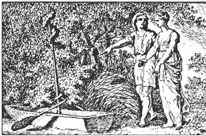
Ο Πρώτος Ναύτης επιδεικνύει το σκάφος του στην Μελίνδα

Την ύπαρξη του έργου: «Ο πρώτος ναύτης» την πληροφορήθηκε,