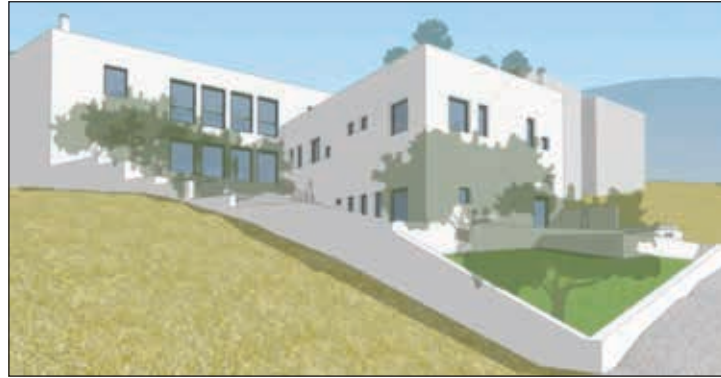
Μακέτα από τη βραβευμένη αρχιτεκτονική πρόταση για το Μουσείο Μεταναστευσης στην Αγία Πελαγία (Στ. Ταβαριδής) μία εμβληματική πρωτοβουλία των Φ.Μ.Κ.

είναι ο στίβος ο καλός και τούτοι εδώ, οι Φ.Μ.Κ., το πήραν ζεστά, κινήθηκαν ζωηρά και μεθοδικά και έχουν επιδεί-