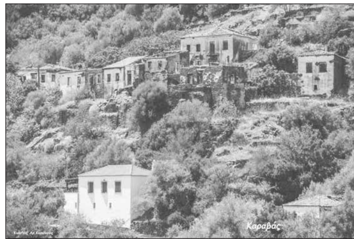
Η επιφανής εικόνα της εγκατάλειψης. Ένας γραφικός οικισμός του Καραβά (Μαυρογιωργιάνικα) χωρίς κανέναν μόνιμο κάτοικο.

Σε λίγα όμως χρόνια, το 1878, ίσως γιατί ο πληθυσμός ήταν δυσανάλογος με τις οικονομικές δυνατότητες του νησιού, αρχίζει η μετανάστευση στην Σμύρνη, και αυτό το γεγονός αποτελεί το δεύτερο μεγάλο ορόσημο έντονης πτώσης του πληθυσμού, με αποτέλεσμα στα επόμενα 12 χρόνια