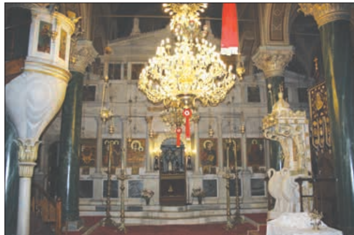
«Τρόπαιο» της νέας δίκης στο ΣΤΕ, το ιερό λίκνο των Κυθήρων!

κανονικά, οι δύο πλευρές προχώρησαν σε κατάθεση των επιχειρημάτων τους και έλαβαν ολιγοήμερη προθεσμία μέχρι τέλους Ιουνίου να καταθέσουν τυχόν συμπληρωματικά στοιχεία. Υπενθυμίζουμε ότι φέτος είχαμε τρεις αναβολές. Στις 27 Ια-