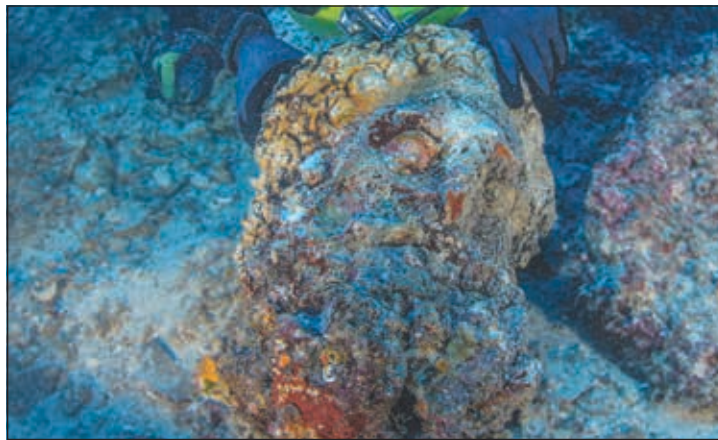
Η μαρμαρίνη κεφαλή Ηρακλέους, όπως βρέθηκε. Πιθανόν συμπληρώνει ακέφαλο άγαλμα του μυθικού ήρωα που βρίσκεται στο Εθν. Αρχαιολογικό Μουσείο.

πλάνου σε συμπαγές συσσωμάτωμα με ίχνη χαλκού, το οποίο δια του γενετικού υλικού του θα βοηθήσει στο προσδιορισμό του φύλου και άλλων γενετικών χαρακτηριστικών του ανθρώπου