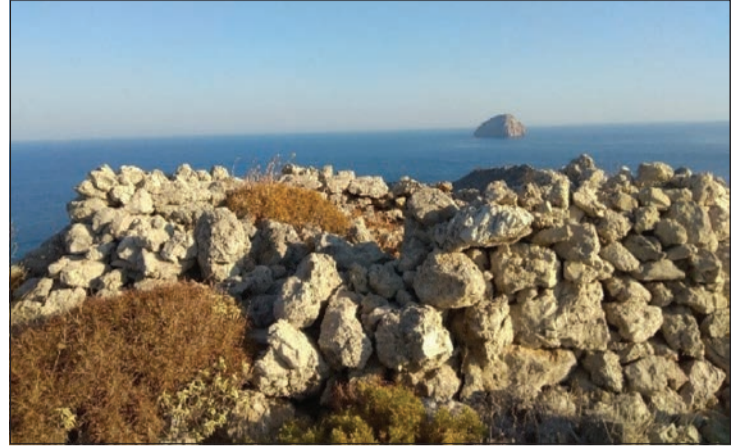
Άποψη από το θεωρούμενο σηματορείο προς τα ΝΔ

τρέπουν να πιστέψουμε πως επειδή ήταν ναυτικό υλικό αρκετής αξίας