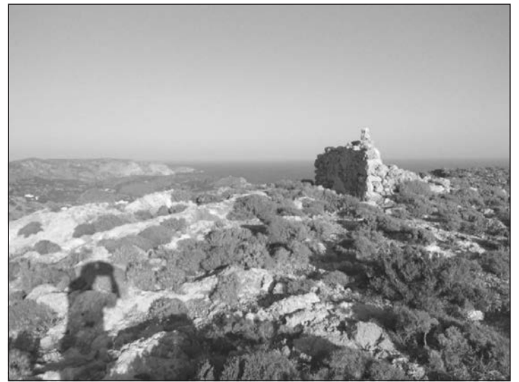
Άποψη των ερειπίων της ερειπωμένης παλαιάς βίγλας

Ας εξετάσουμε την περίπτωση χρήσης της παλαιάς βίγλας, ως υποστηρικτικού κτηρίου. Δεν θα μπορούσε να είναι εκεί το σηματορείο, δίπλα σε μια κτηριακή υποδομή; Εδώ μπαίνουμε στην σφαίρα της μελέτης των μετεωρολογικών φαινομένων. Οι λόγοι που δεν θα έβαζε ένα μηχανικός έναν ιστό στην κορυφή του λόφου είναι απλός: οι κεραυνοί. Ένας ιστός που εμπεριέχει έστω και λίγα μεταλλικά τμήματα θα ήταν πρόκληση για τους κεραυνούς. Μην ξεχνάμε άλλωστε το περιστατικό του κεραυνού στην Μυρτιδιώπισσα, του Κάστρου της Χώρας. Ο κεραυνός πέφτει στο καμπαναριό της εκκλησίας, που είχε μια απλή μεταλλική κατασκευή στην κορυφή, όπως συνήθιζεται (σταυρό με ανεμούριο ή απλή μπάλα κανονιού), μπαίνει μέσα στο βοηθητικό δωμάτιο της εκκλησίας, συνεχίζει μέσα από τον δρόμο και ξεσπάει στον χώρο του διοικητηρίου, μόλις μέσα από την είσοδο του Κάστρου. Άρα ο οικίσκος της Βίγλας δεν μπορεί είναι το σημείο του σηματορείου. Αυτό θα πρέπει να είναι χαμηλότερα από την κορυφή, αλλά να εξακολου-