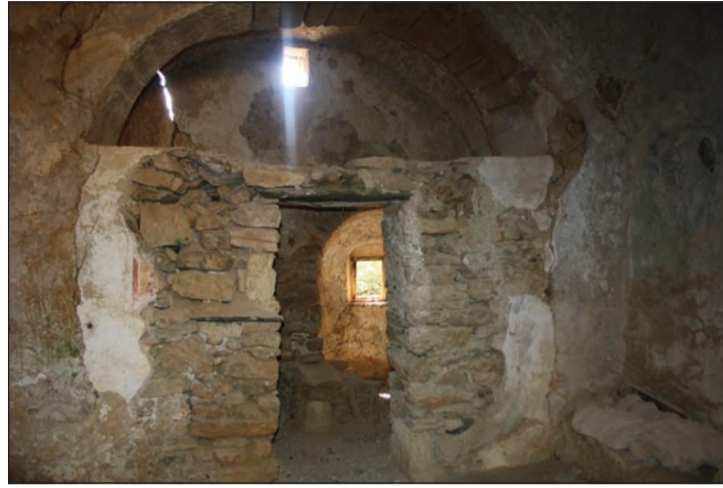
Άποψη από το εσωτερικό του ναού και τοιχογραφίες

Η Αγία Θοδώρα είναι ένας ναός που μας έχει απασχολήσει και άλλες φορές, όχι μόνο γιατί ήταν για πολλά χρόνια στάβλος για ζώα, αλλά και γιατί σε κοντινή απόσταση υπάρχει