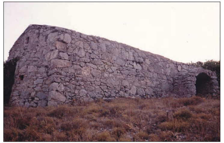
Το εξωτερικό του ναού από τη ΒΑ πλευρά

τός παραμένει σε κακή κατάσταση και μάλλον βρίσκεται κι αυτός κοντά στην κατάρρευση. Η πρόσβαση είναι δύσκολη αν και όχι αδύνατη και μπορεί να τον προσεγγίσει κανείς από διαστάυρωση του δρόμου Λειβάδι-Κάλαμος, κοντά στην τοποθεσία Χάλα. Ασφαλώς και ο ναός αυτός είναι ένας από τους πολλούς που χρειά-