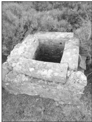
Η στέρνα (πύρινο ρείθρο)

Το πρώτο που κάναμε ήταν να μελετήσουμε την μορφή όσων σηματορείων, της ίδιας περίπου εποχής, απεικονίζονται σε σχέδια ή και φωτογραφίες. Αυτό θα μας επέτρεπε να καταλήξουμε στην μορφή που ενδεχόμενα θα είχε ένας μικρός signal station, δηλαδή σταθμός σημάτων,