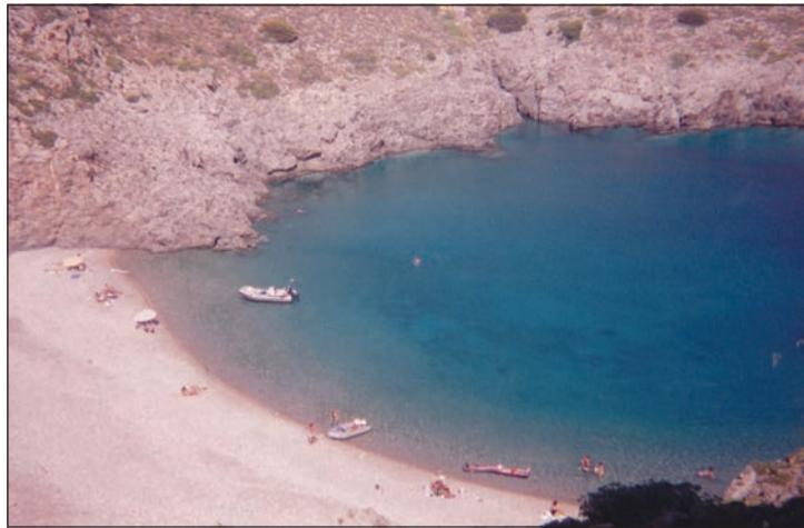
Τη δημοφιλή παραλία στο Χαλκό φαίνεται τη δέρνει κάποια ...κατάρτα, αφού η θάνατη γραφειοκρατία ούτε φέτος επέτρεψε να ολοκληρωθεί η σκωλικοειδής απόφωση των 800μ της δύσκολης κατάληξης του δρόμου

Πάντα είχαμε πρόβλημα με τη γραφειοκρατία που καθυστερούσε ή και έβαζε στο «ψυγείο» έργα, όμως τελευταία το κακό φαίνεται να έχει παραγίνει. Και εκεί που όλοι είχαμε πιστέψει ότι κάτι μπορεί να προχωρήσει με το λεγόμενο «επιπελικό κράτος» ξαφνικά κι αυτό δείχνει να έχει πέσει στις δαγκάνες της θάνατης γραφειοκρατίας ή της οικονομικής καχεξίας. Στην πρώτη περίπτωση, που έχουμε τα πιο πολλά παραδείγματα στον τόπο μας, έχουμε τις μεγάλες καθυστερήσεις από την Αποκεντρωμένη Διοίκηση και όχι μόνον, για εγκρίσεις προϋπολογισμών και έργων, αλλά και τυπικές διαδικασίες, που αντί να χρειαστούν λίγες μέρες ή βδομάδες παίρνουν μήνες με κίνδυνο, είτε να καθυστερούν έργα, είτε να κινδυνεύουν με ματαίωση άλλα. Θα αναφέρουμε μερικά χρήσιμα παραδείγματα. Εδώ και 8 περίπου μήνες δημοπρατήθηκε η περίφημη «σκωλικοειδής απόφωση» για αποπεράτωση των 800μ στο δρόμο του Χαλκού. Ο μειοδότης ακόμη να ξεκινήσει με ευθύνη της Αποκεντρωμένης και το έργο πάει πλέον για το Φθινόπωρο με άλλη μία σεζόν χαμένη για τη δημοφιλή παραλία. Αντίθετα, προχωρεί πριν το καλοκαίρι το αντίστοιχο στη Φυρή Άμμο (Λειβάδι), επειδή έχει κόστος μόλις 10.000€ λιγότερο και εμπίπτει σε άλλη κατηγορία. Η βελτίωση του υπολοίπου του δρόμου προς Μελιδόνι (Καλαμάργος) ενώ έγινε δημοπρασία δεν θα ολοκληρωθεί πριν το καλοκαίρι, γιατί ακόμη να υπογραφεί σύμβαση εξ αιτίας τυπικών διαδικασιών. Πιο χαρακτηριστική όμως και εξόχως «επικίνδυνη» περίπτωση είναι οι αφαλατώσεις σε Αγία Πελαγία και Διακόφτι . Είχαμε