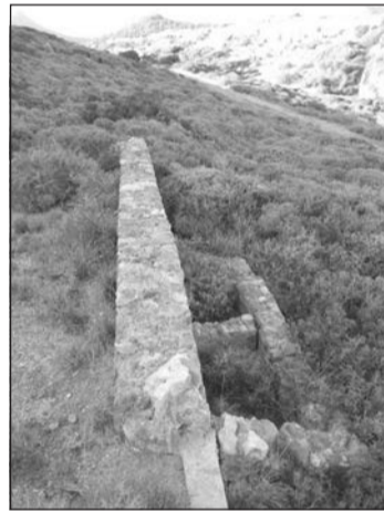
Το τοίχιο και οι ενσωματωμένες δύο ποτίστρες

οδηγεί στην άποψη αυτή. Βεβαίως τέτοιοι ιστοί περιλαμβάνουν και μεταλλικά τμήματα αλλά ο μόνος τρόπος να τα εντοπίσουμε θα ήταν να βρεθούν αυτά τα κομμάτια. Όμως επειδή αυτά είναι, σχετικά, μικρά και σίγουρα έχουν αλλοιωθεί από τον καιρό δεν πιστεύουμε πως θα υπάρχουν αξιόλογα ίχνη. Μια άλλη περίπτωση είναι να μετακινήθηκε ο ιστός. Δηλαδή όταν έφυγαν οι Άγγλοι να το πήραν μαζί τους, ως υλικό πλοίου, ή ακόμη και να το κατέστρεψαν. Αυτή η άποψη συνάδει με το γεγονός της μη ύπαρξης δευτερευόντων στοιχείων, αλλά και με το γεγονός πως δεν έχουμε καμία αναφορά σχετικά. Είναι σχετικά εύκολο να θεωρήσουμε πως η μικρή απόσταση από την Χώρα (λιγότερο από ένα τέταρτο με τα πόδια) υπαγόρευε την χρήση μη μόνιμης κτηριακής υποστηρικτικής κατασκευής, αφού ο σταθμός θα λειτουργούσε από φως σε φως (πρωί έως βράδυ) και η μικρή απόσταση από την Χώρα επέτρεπε την σύντομη πεζοπορία των χειριστών-στρατιωτών. Άρα ισχύει η άποψη μας περί πρόχειρης κατασκευής, του σωζόμενου κύκλου, πάνω από τον οποίο θα πρέπει να υπήρχε πρόχειρη κάλυψη,