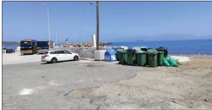
Οι κάδοι στην Αγία Πελαγία που δημιούργησαν το θέμα, σε φωτογραφία πριν απομακρυνθούν. Όντως αντιαισθητικό θέαμα στο έμπα του παραθαλάσσιου τουριστικού οικισμού