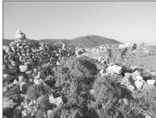
Άποψη του Κάστρου της Χώρας μέσα από τα ερείπια της παλαιάς βίγλας, στην κορυφή του λόφου

όπως φαίνεται στον αντίστοιχο της Burma. Μάλιστα θα μπορούσε να είναι από ιστία, αντί της ξύλινης σκε-