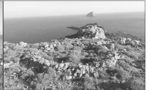
Άποψη του ίδιου σημείο από το ψηλότερα

Δυστυχώς πρόκειται για εικόνα χαμηλής ανάλυσης και δεν μας αποδίδει ιδιαίτερες πληροφορίες. Συγχρόνως δεν φαίνεται το επίμαχο σημείο ώστε να ξεκαθαρίσει η συζήτηση. Η υδατογραφία προέρχεται από ιστοσελίδα οίκου δημοπρασιών. Δυστυχώς δεν υπάρχει πιά στο διαδίκτυο, όσο και να προσπαθήσαμε να την εντοπίσουμε. Το σημείο είναι από την πρωινή του βόλτα, στις 23 Μαΐου 1863, στην Ψαρή μέχρι την βάση του λόφου της Βίγλας, από την διαδρομή του Αγίου Μηνά, του διπλού νεκροταφείου και της πηγής με τις γούρνες-πλυντήρια. Ο Lear είναι ένα τοπιογράφος με μια ματιά, σχεδόν φωτογραφική. Έχουμε στοιχεία του ημερολογίου του, όπου αναφέρεται στην κλωρίδα περιοχών -όπως ο Κα-