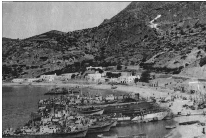
Η ιστορική φωτογραφία του Εμμ. Σοφιού από την απόβαση των Αγγλικών δυνάμεων στο Καψάλι.

ΟΙΚΟΠΕΔΟ άρτιο και οικοδομήσιμο 4.720 τ.μ. πωλείται στην Αγία Αναστασία. Απεριόριστη θέα θάλασσας. Τηλ. 210 4293684