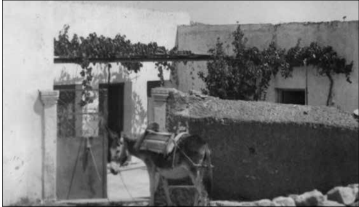
Το πατρικό σπίτι του αείμνηστου Βασ. Λευθέρη. Σε πρώτο πλάνο η γαϊδούριτσα της οικογένειας, η Κριτσού, που φορτώθηκε τα μπουγαδοκάζα με την κατσίκα και την πήγε φαγητό στους αντάρτες στο κάστρο.

Έτσι γνωρίσαμε τον Καπετάν Φλώρο, έναν από τους «αντάρτες» που είχαν έλθει από την Πελοπόννησο να πολεμήσουν τους Γερμανούς