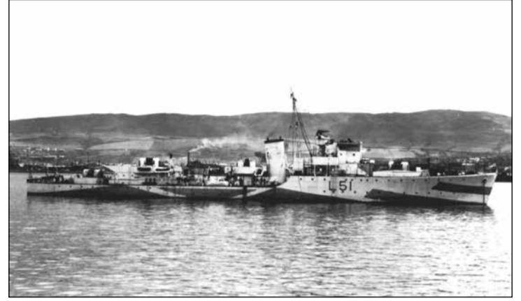
Το αντιτορπιλικό «Θεμιστοκλής», που έφερε τμήματα από τον Ιερό Λόχο στα Κύθηρα.

λίνης του Μαραθώνα και το ηλεκτρικό εργοστάσιο του Κερατσινίου παρ' όλο που είχαν προετοιμάσει τις