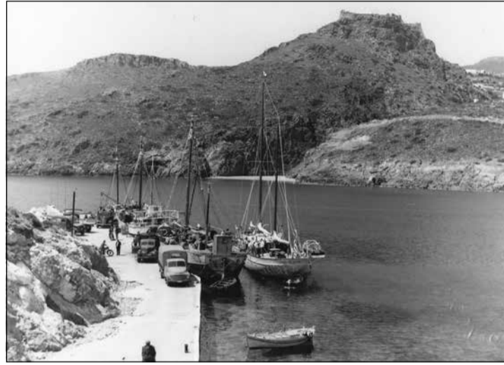
Παλαιά φωτογραφία του Καψαλιού με τα κείκια να ξεφορτώνουν στα φορτηγά της εποχής στην προβλήτα που αναφέρεται στο κείμενο.

Μετά την κατασκευή του λιμανιού στο Διακόφτι, και την μεταφορά της ακτοπλοϊκής συγκοινωνίας εκεί, η Αγία Πελαγία, η οποία έχει το πλεονέκτημα της γειτνίασής με την απέναντι ακτή της Πελοποννήσου, και επειδή είναι επίσης μια ταχύτατα αναπτυσσόμενη τουριστική περιοχή,