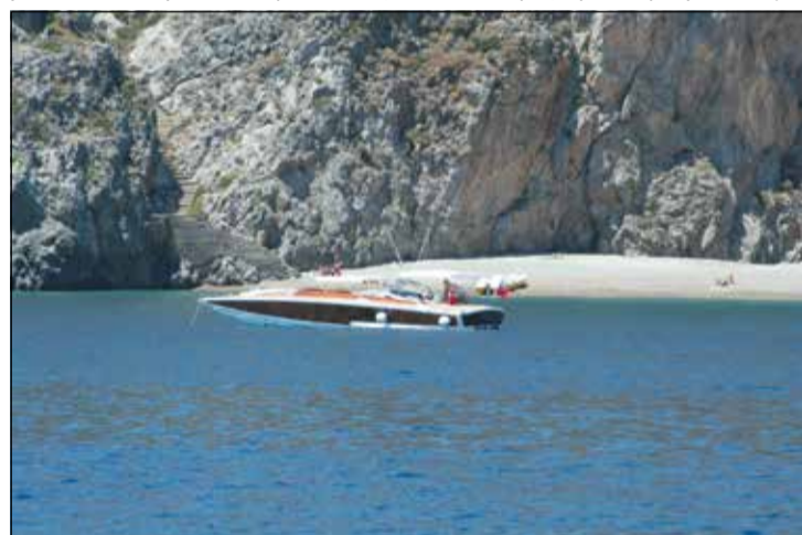
Η γραφική παραλία στο Σπαραγαρίο στην καρδιά του Καψαλιού σε παλαιότερη φωτογραφία. Κι εδώ αποβιβάστηκαν μετανάστες τον Αύγουστο.

ελεγχθεί άμεσα και η οποία ανέφερε ότι στο κινητό ενός μετανάστη βρέθηκε sms που ανέφερε ότι το νησί είναι αφύλακτο (άρα μπορούν να προσεγγίσουν σκάφη άνετα με ελάχιστο κίνδυνο να γίνουν αντιληπτά). Αυτό επιβεβαιώθηκε τις τελευταίες ημέρες του Αυγούστου, όταν ένα τέτοιο σκάφος έφθασε μέχρι το Καψά-