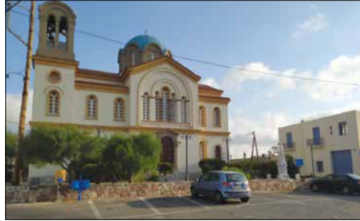
Αριστερά ο σημερινός νέος ναός του Αγίου Γεωργίου.

Ο παλιός βρισκόταν στο κτήριο που διακρίνεται δεξιά και κατεδαφίστηκε το 1911. Δίπλα βρισκόταν ο Σωτήρας.