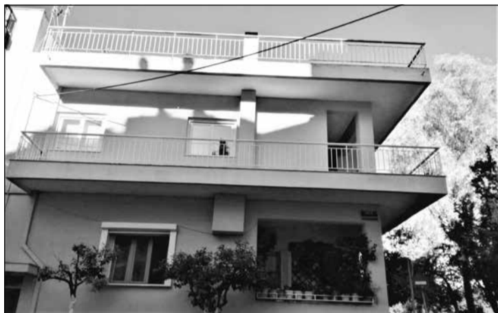
Στη γειτονιά μου καλώδιο του ηλεκτρικού ρεύματος εμπόδιζε την τοποθέτηση τέντας. Έγινε αίτηση υπογειοποίησης.

επικυρωθεί από το Δημοτικό Συμβούλιο και δίχως να έχει περιληφθεί σε προεκλογικό πρόγραμμα. Παρακάμφθηκε και η διαδικασία που οι άλλοι Δήμοι ακολουθούν σε παρόμοιες περιπτώσεις. Με άλλα λόγια η αλλαγή αυτή δεν είναι σφραγισμένη με τη νομιμότητα που απαιτείται. Η εικόνα τού νέου συμβούλου, δεν παραπέμπει στα Κύθηρα. Και ο πιο έμπειρος βοτανολόγος δεν μπορεί να αναγνωρίσει πως πρόκειται για κλώνο μυρτιάς. Η λόγχη, ως ένα από τα Επτανήσια που κρατούσε ο πολεμικός λέων τού Ιονικού Κράτους, του προκεχωρημένου φυλακίου, δηλαδή, της αποικιοκρατικής Αγγλίας, δεν μπορεί να σχετισθεί με τα φιλειρηνικά Κύθηρα και το κάλλος τους. Τις λόγχες τις τοποθέτησαν οι κατακτητές Άγγλοι για να υπενθυμίζουν