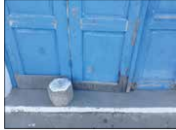
Ένας ταμπεντόλιθος συγκρατεί την εξώπορτα!

τελευταίο, όπως επισημόναμε πέρσι. Τώρα έχουμε το κτήριο του Συνδέσμου. Δεν λέμε για την κατάσταση στις τουαλέτες που προκαλούν αποτροπισμό, αλλά γενικά το κτήριο έχει πλήρως παραμεληθεί. Η κεντρική είσοδος χρειάζεται ταμπεντόλιθο για να κλείσει