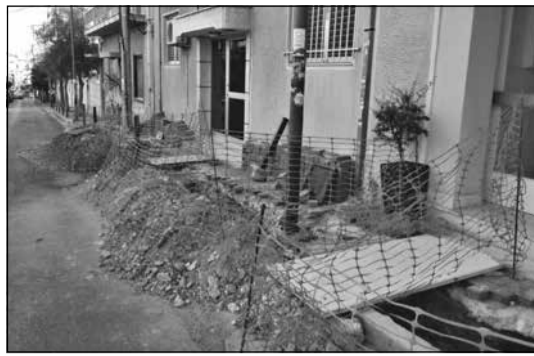
Εντός λίγων ημερών και με λογική οικονομική επιβάρυνση, ολοκληρώθηκαν τα έργα.

στους ανταγωνιστές τους, Γάλλους, Ρώσους και Οθωμανούς, πως κάθε νησί αποτελεί πολεμικό ανάχωμα για αυτούς. Κάθε νησί και μια λόγχη στα πλευρά τους. Λόγχες καταπίεσης και για τους Επτανήσιους, εξ ου και η «Ψεύτρα Ελευτεριά» τού Εθνικού μας Ύμνου. Θεωρώ παράλογο να υιοθετούμε ως σύμβολο ένα πολεμικό όπλο, αυτό μάλιστα που λόγχισε το πλευρό τού Ιησού μας. Τη λόγχη που αυτή ενέπνευσε τους αγιογράφους για να ολοκληρώσουν τη μορφή τού «έξω από δω». Ας ξεκαθαρίσουμε και ένα άλλο θέμα. Η Ελληνική γραμματεία έχει κατατάξει το 12θεο στην Ελληνική Μυθολογία. Ο έννοια της «Μυθολογίας» εξ ορισμού αποκλείει και το παραμικρό ίχνος θρησκευτικής ουσίας. Μόνο ιδέες, που την αξία τους έχουν αναδείξει οι σοφοί πρόγονοί μας, παίρνουμε από τη Μυθολογία, μέσω των θαυμάσιων συμ-