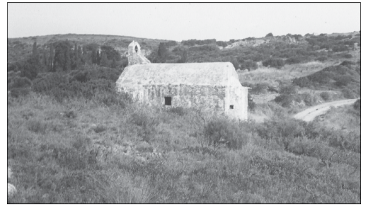
Ο Σωτήρας Πενταρμενάς στον Κάλαμο σε φωτογραφία του 1989.

τέλη του 17ου αι. ίσως όμως να ήταν πολύ παλαιότερο, αφού και οι Μαγγουνάδες αναφέρονται στις γραπτές πηγές από το 14ο αι. Στον πιο γνωστό Κάλαμο τώρα, αξιο αναφοράς είναι το παλιό μικρό μοναστήρι του Σωτήρος Πενταρμενά ΒΑ του οικισμού. Ο ναός αναφέρεται να ήταν αρχικά δυσκολότερα και να τον μετακίνησαν λόγω κατολίθωσης. Η ονομασία δεν γνωρίζουμε πώς ερμηνεύεται, καθώς έχουν ακουστεί οι εκδοχές από το Πέντε Άρμενα και από το Παντέρμος. Πιθανότερο το δεύτερο αν κι εδώ μάλλον έχουμε τοπωνύμιο που