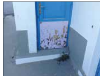
Η κατάσταση της εξώπορτας.

Για να κλείσουμε. Δεν γράφουμε για να ασκήσουμε κριτική στις διοικήσεις του Συνδέσμου για όσες ευθύνες ενδέχεται να τους αναλογούν, ούτε γιατί έχουμε κάτι μαζί τους. Δυστυχώς σε παρόμοια κατάσταση βρίσκονται