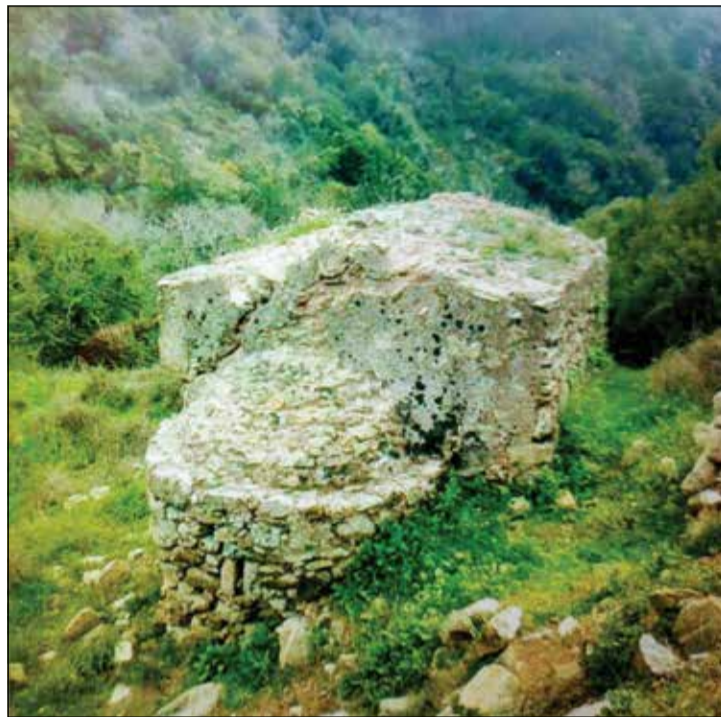
Ο Άγιος Νικόλαος στον Κάλαμο, στα Περλεγκιάνικα.

αναφέρεται από τα τέλη του 17ου αι., όμως οι μελέτες των αρχαιολόγων