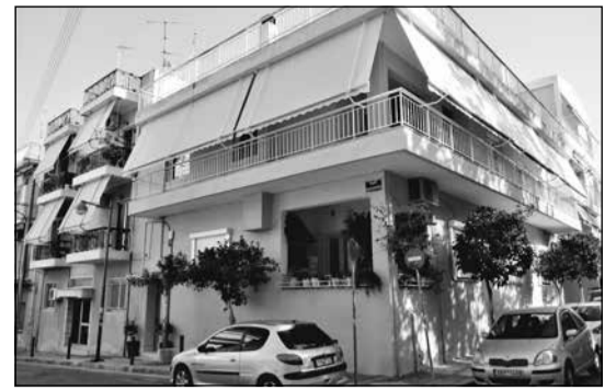
Οι τέντες τοποθετήθηκαν. Για όλη την Ελλάδα το ίδιο ισχύει. Μπορούμε και στα Κύθηρα.

καλεί. Εκπληκτικό βλέπουμε η συστηματική και μακροχρόνια εξαφάνιση της Αναδυομένης από τα τουριστικά έντυπα των Κυθήρων και από τα περίπτερα των τουριστικών εκθέσεων ανά τον κόσμο, να καταλήγει σε θλιβερή και ολέθρια «επίσημη» κατάργησή της. Πρέπει το αληθές, το εθνικό δηλαδή, να επικρατήσει στον τόπο μας. Και μη ξεχνάμε τον Παλαμά: «Κριτές θα μας δικάσουν... οι αγέννητοι, οι νεκροί».