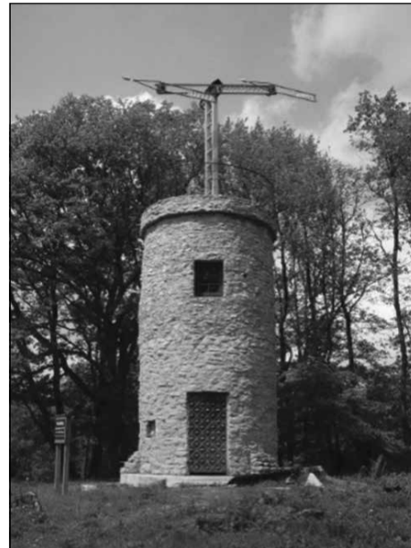
Εικόνα 5 Ανακατασκευασμένο αντίγραφο σταθμού οπτικού τηλεγράφου στο Nalbach, Γερμανία.

μεγάλη όταν ο ομιλήτης αναφέρθηκε διεξοδικά στο κτίριο του σηματορείου στο Μουδαρί. Είχαμε εικόνα του συγκεκριμένου, αφού είχαμε επισκεφθεί αρκετές φορές την ευρύτερη περιοχή, αλλά δεν είχαμε ασχοληθεί επισταμένα. Ο καθηγητής είχε επιστήσει και επισκεφθεί τον χώρο, κατά την διάρκεια διακοπών του σε φιλικό σπίτι στα Κύθηρα, κρατώντας εκτενείς σημειώσεις. Αυτές εξελίχθηκαν στην παρουσίασή του, όπου παρουσίασε και πιθανή αναπαράσταση του μηχανισμού -βασισμένος στα μεταλλικά κομμάτια που διασώζονται. Η τεκμηρίωση της ύπαρξης ενός τέτοιου σταθμού στα Κύθηρα, αλλά και των εμφανών υπολειμμάτων των μηχανισμών του, είναι κεφαλαίου σημασίας για την ικνολογία της Ιστορίας του νησιού. Κατά την διάρκεια της Αγγλικής διοίκησης δημιουργήθηκαν πολλά δημόσια κτίρια (όπως τα αλληλοδιδασκαστικά σχολεία και το Λαζαρέτο), γέφυρες, υποδομές (το νεποζίτο νερού στο Καψάλι και το «σιντριβάνι» στο Μανιτοχώρι), η καλύτερη οδόστρωση τόσο του κεντρικού όσο και αρκετών περιφερειακών δρόμων, έργα που έγιναν με την άμεση συνδρομή των Κυθηριών, τόσο σε χειρωνακτική εργασία όσο και σε επίπεδο εργολαβίας. Ο φάρος του Καψαλίου (1853) και ο φάρος του Μουδαρίου (1857) υπήρξαν