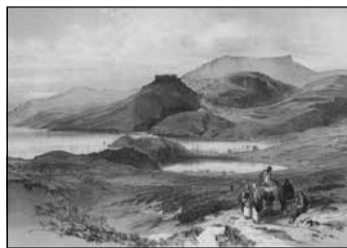
Εικόνα 1 Το κάστρο και η πόλη των Κυθήρων και το λιμάνι στο Καψάλι (Edward Lear, 1863). Γκραβούρα.