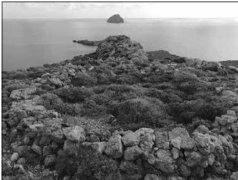
Εικόνα 4 Άποψη της κατασκευής. Θέα προς Ν-ΝΑ.