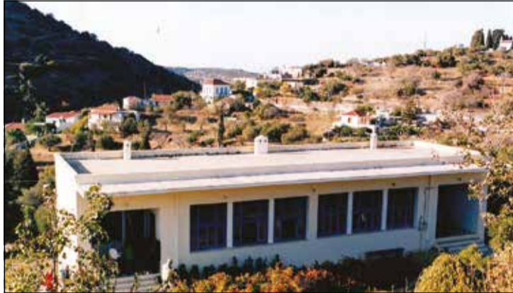
Η Πατρικία σχολή στον Καραβά

έργα ευποΐας στον τόπο. Και σωστά δίνουμε έμφαση σε αυτά, γιατί αφορούν πάντα το μεγαλύτερο μέρος του πληθυσμού και από αυτά ωφελούνται περισσότερο. Υπάρχουν όμως και άλλοι που χρήζουν μνείας και αποτελούν φωτεινό παράδειγμα σε ένα τόπο. Μεγάλος ευεργέτης ασφαλώς ο Δηλαβέρης κι ο Πατρίκιος που έπλυναν σχολεία για να μαθαίνουν γράμματα τα παιδιά ή