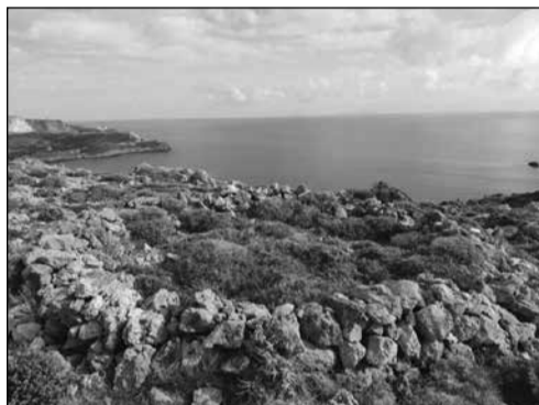
Εικόνα 3 Άποψη της κατασκευής. Θέα προς Ν-ΝΑ.