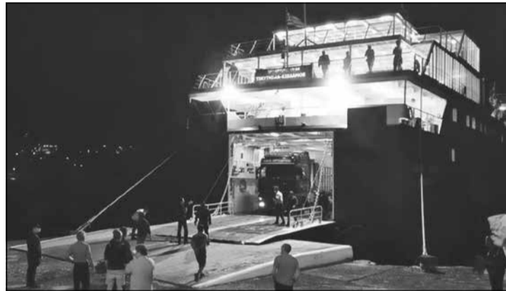
Το AGOJA JEWEL δένει δίχως πρόβλημα στην Αγία Πελαγία όταν στο Διακόφτι φυσούν ισχυροί τοπικοί άνεμοι. Μα η αλλαγή αυτή προκαλεί προβλήματα.

3ος σημαντικός: Το είδος του βυθού. Ο καπετάνιος Σαντορινιός καταθέτει: «Στο Διακόφτι οι δυσκολίες παρουσιάζονται από τους ισχυρούς ανέμους που το προσβάλλουν, εν συνδυασμό με την υφή του βυθού. Ο καλύτερος βυθός είναι ο λασπώδης και αμμώδης. Εκεί γαντζώνεται η άγκυρα, μα και αποσύρεται εύκολα. Στο Διακόφτι ο βυθός είναι πλακώδης, σέρνει η άγκυρα και παρασύρεται το πλοίο όταν φυσά άνεμος. Ο έξω απ' το λιμάνι βυθός είναι καλός κι η άγκυρα «πιάνει», όμως, χρειάζεται μεγαλύ-