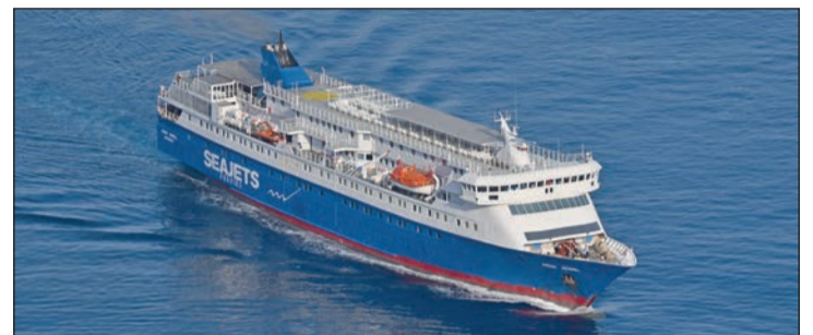
Το AQUA JEWEL

ακολουθήσει η αξιολόγηση των οικονομικών προσφορών κατά τη Β΄ φάση του διαγωνισμού, η οποία αναμένεται