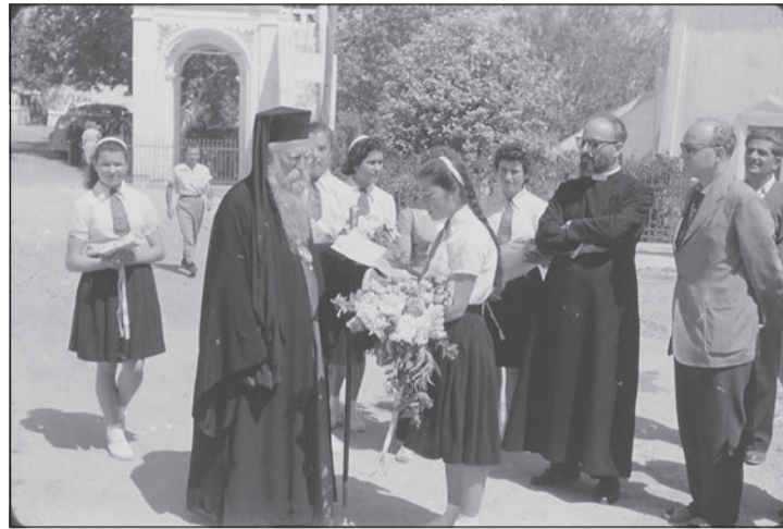
Ο Μητροπολίτης Μελέτιος σε φωτογραφία του 1960 στο Μυλοπόταμο. Μάλλον το μοναδικό θέμα στο οποίο είχαν συμφωνήσει την εποχή αυτή οι δύο τοπικές εφημερίδες των Κυθέρων ΚΥΘΗΡΑΪΚΗ ΔΡΑΣΙΣ και ΦΩΝΗ ΤΩΝ ΚΥΘΗΡΩΝ, που στάθηκαν αντίθετες στην απόφαση του Μητροπολίτη να καταργήσει το παζάρι στον Ποταμό.

ικανοποίηση όλων των άλλων ανάγκας της».