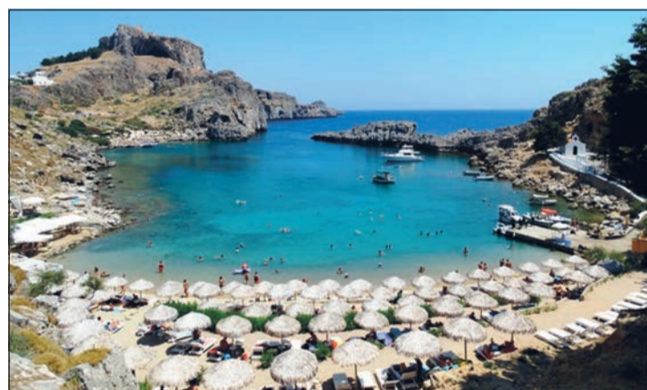
Η Λίνδος στη Ρόδο. Οι χιλιάδες ομπρέλες εκεί δεν...ενοχλούν κανέναν. Στην Παλιόπολη τους μάραναν!

στην υπέροχη και...αχανή παραλία της Παλιόπολης δεν υπήρχαν ομπρέλες, ξαπλώστρες, αλλά ούτε και καντίνες, με αποτέλεσμα βέβαια την ταλαιπωρία όσων επισκεπτών προτιμούσαν την παραλία αυτή για να κάνουν τα μπάνια τους και καίγονταν στον καυτό