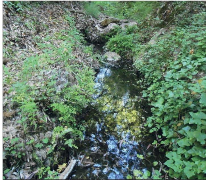
Μικροφράγμα στον Καραβά.

μικρότερης προβολής του βιώσιμου τουρισμού στο νησί μας. Το δίκτυο μετονομάστηκε σε 'Kythera Trails -