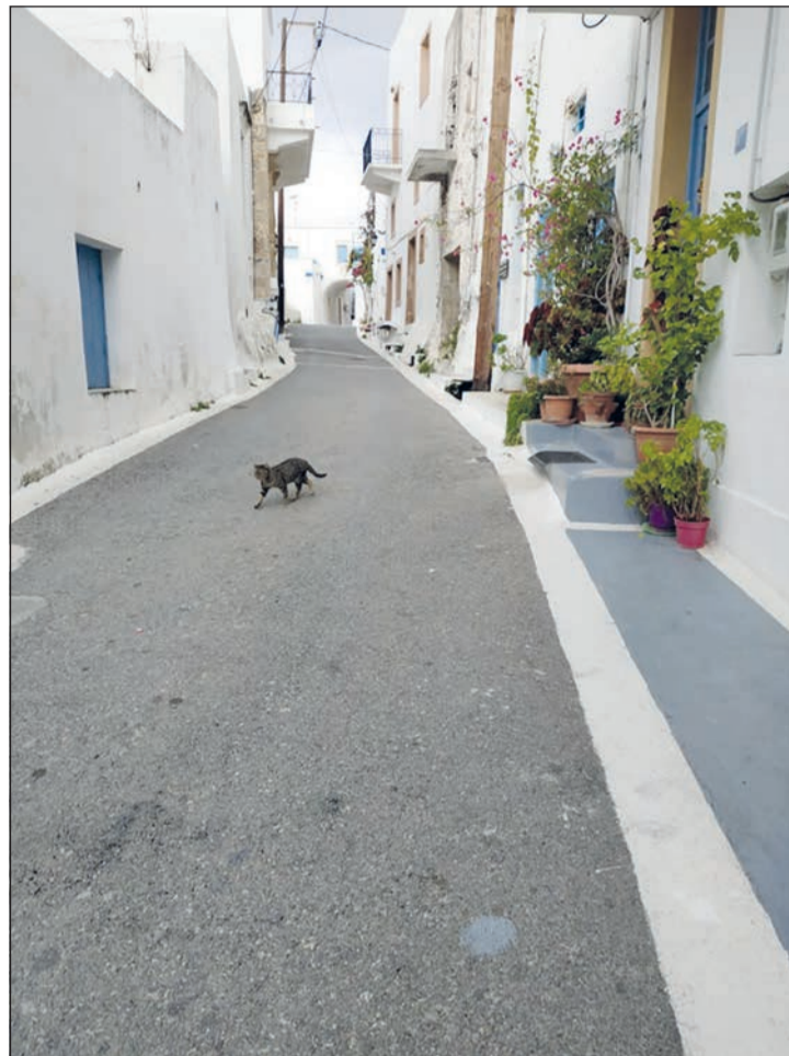
Φωτογραφία της Ελένης Χάρου από την έρημη Χώρα, πολύ συνθησιμένο θέαμα τους χειμερινούς μήνες. Εδώ τη μονοτονία σπάει η συμπάθηστα ψιμίνα, η μοναδική ζωή στο δρόμο την ημέρα της φωτογραφίας.

πολλές φορές, αλλά άνθρωποι έξω δεν κυκλοφορούν πολλοί. Ακόμη και οι μετανάστες από την Αλβανία