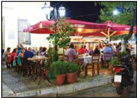
ΠΟΤΑΜΟΣ - Τηλ.: 27360 38313 κιν.: 6981 900296

Σας περιμένουμε στον Ποταμό, στην ψησταριά ΓΕΥΣΗ ΕΛΛΑΔΑΣ, με παραδοσιακές συνταγές φροντισμένες με γούστο και μεράκι. Με τα πιο αγνά και ολόφρεσκα υλικά σε συνδυασμό με την σύγχρονη αντίληψη στο ψήσιμο, σας προσφέρουμε πάντα υψηλής ποιότητας φαγητό. Απολαύστε το με... κλειστά μάτια!