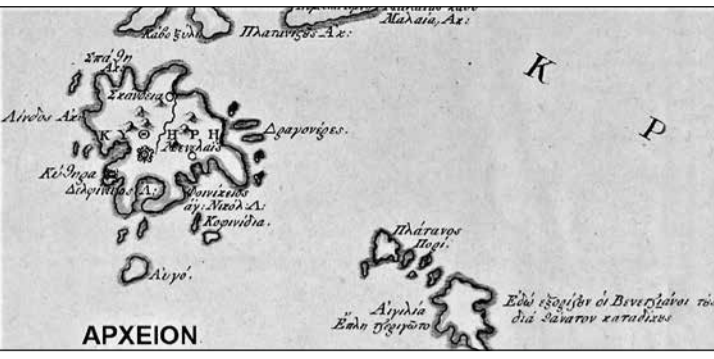
Τμήμα από τη Χάρτα του Ρήγα που περιλαμβάνονται τα Κύθηρα και τα Αντικύθηρα.

Τα στοιχεία που περιλαμβάνει η Χάρτα του Ρήγα για τα Κύθηρα είναι αξιοπρόσεκτα. Ως όνομα του νησιού δίνεται το ΚΥΘΗΡΗ. Το περιγράμμά του δεν προσεγγίζει την πραγματικότητα, αλλά αυτό είναι απόλυτα αναμενόμενο για εκείνη την εποχή. Από τα περίξ σημειώνω ότι ο Ρήγας αναφέρει ως δεύτερο όνομα του Λα-