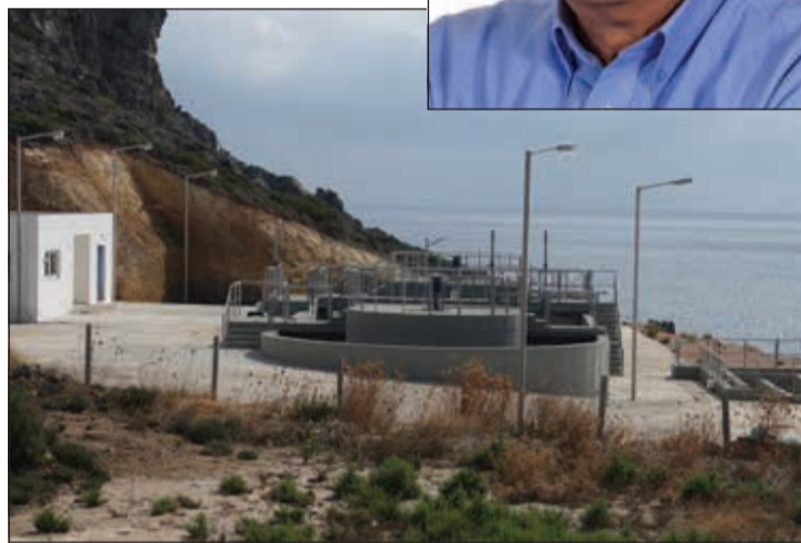
Ο Βιολογικός στο Καβάλι, που υπολειπεται λόγω έλλειψης λυμάτων είναι το μόνο αντίστοιχο έργο στο νησί και πρέπει να συνδεθούν και άλλα χωριά με αυτόν. «Κ»

ήταν εφικτό να συμμετέχω ενεργά. Με την συνταξιοδότηση μου όμως και την μόνιμη εγκατάσταση μου στο νησί, αποφάσισα να δραστηριοποιηθώ πολιτικά έχοντας μοναδικό σκοπό την ανάπτυξη των νησιών μας