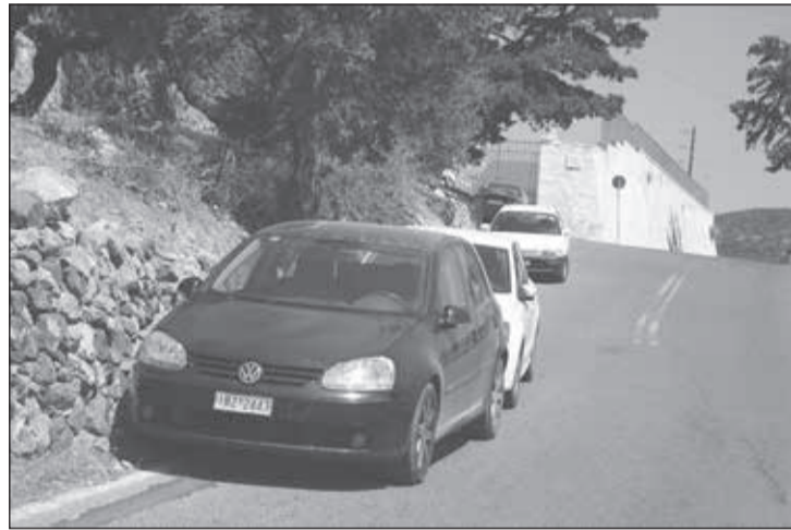
Στάθμευση στο δρόμο με κλείσιμο της μίας λωρίδας κάτω από το Γυμνάσιο στη Χώρα!

αυτοκινήτων. Ειδικά τη νύχτα δύσκολα κυκλοφορούσε κανείς στους δρόμους χωρίς να τον τυφλώνουν φώτα ή να διακινδυνεύει από άσχετους οδηγούς, που κινούνταν στη μέση του δρόμου αφήνοντας τους