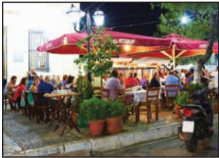
ΠΟΤΑΜΟΣ - Τηλ.: 27360 38313 κιν.: 6981 900296

Σας περιμένουμε στον Ποταμό, στην ψησταριά ΓΕΥΣΗ ΕΛΛΑΔΑΣ, με παραδοσιακές συνταγές φροντισμένες με γούστο και μεράκι. Με τα πιο αγνά και ολόφρεσκα υλικά σε συνδυασμό με την σύγχρονη αντίληψη στο ψήσιμο, σας προσφέρουμε πάντα υψηλής ποιότητας φαγητό. Απολαύστε το με... κλειστά μάτια!