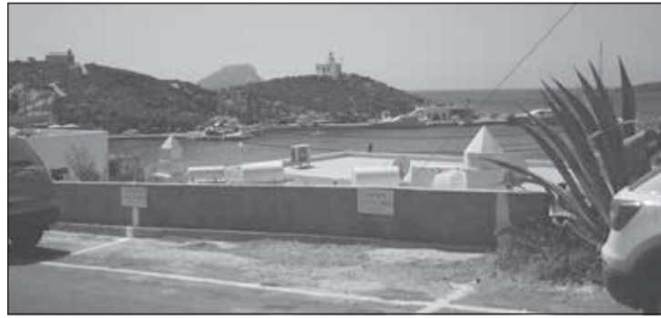
Οριοθέτηση ιδιωτικού χώρου στάθμευσης εν αγνοία του Δήμου.