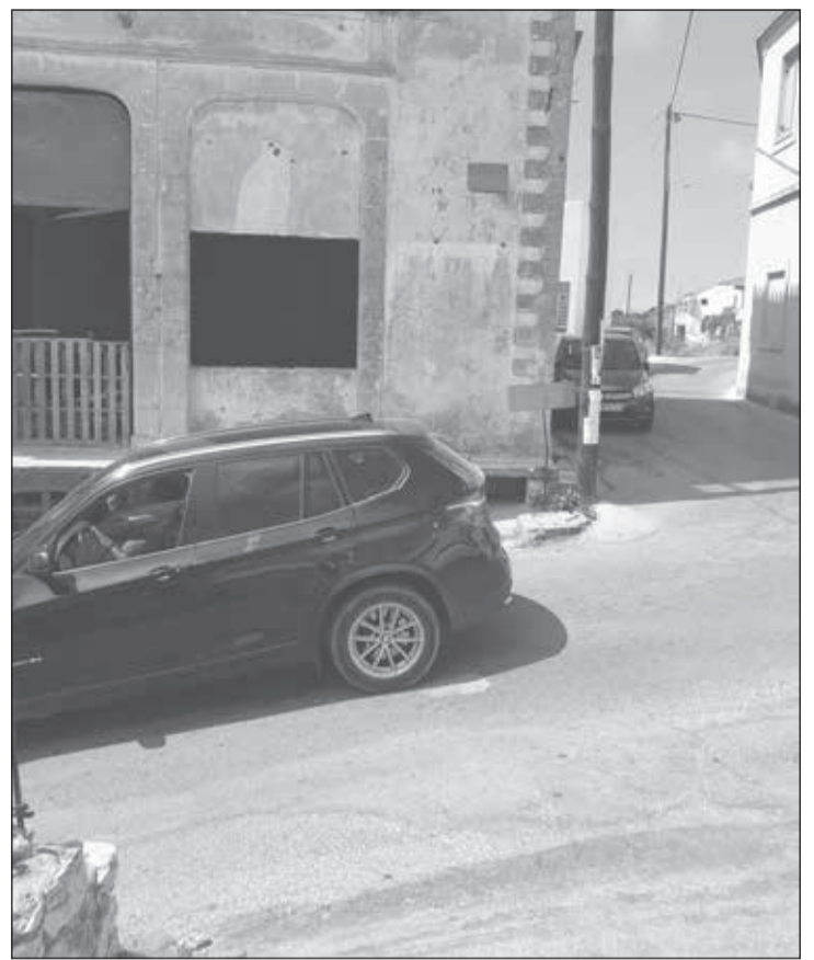
Η γνωστή «διαβολοστροφή» στον Ποταμό που ταλαιπωρεί τους οδηγούς, αλλά ουδέν μέτρο έχει ληφθεί.