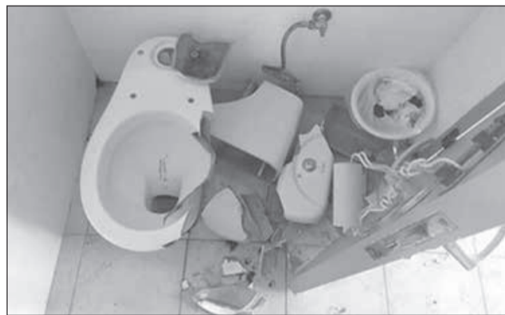
Βανδαλισμός στην τουαλέτα στην Πλ. Άγιο. «Συχαρητήρια» στον καλό άνθρωπο που έμαθε να καταστρέφει!

Στο Λειβάδι, αλλά και στον Ποταμό, έτυχε πολλές φορές να χρειασθούν γύρω στα 20' οι οδηγοί για να διασχίσουν το κέντρο σε μία διαδρομή που δεν χρειαζόταν πάνω από 3! Ειδικά τις ημέρες με το παζάρι διάφοροι οδηγοί σταματούσαν σε διπλές σειρές, έκλειναν διασταυρώσεις, στάθμευαν για ώρες πάνω σε αυτές και δημιουργούσαν μεγάλο πρόβλημα. Ακόμη και το δρόμο που οδηγεί στο Στραπόδι στη Νότια είσοδο του Λειβαδίου κατάφεραν να κλείσουν ασυνείδητοι