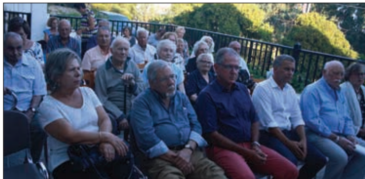
Πάνω, φωτογραφία από την εκδήλωση και κάτω η αίθουσα εστίασης ανακαινισμένη και με νέα έπιπλα λίγες μέρες πριν τη λειτουργία της.