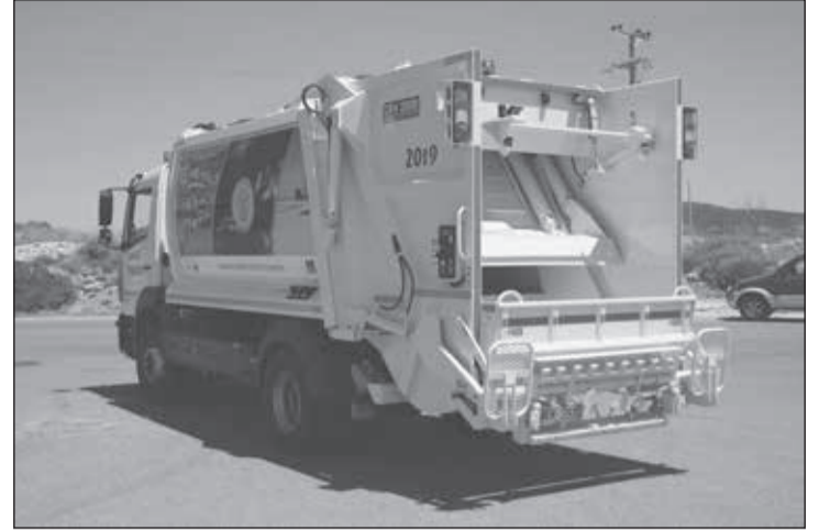
Ένα από τα δύο υπερσύγχρονα απορριμματοφόρα που θα εκσυγχρονίσουν τον πανάρχαιο στόλο του Δήμου.

να πάρουν ένα σουβλάκι χωρίς να βγουν από το αυτοκίνητο! Την Αστυνομία κι εδώ δεν την είδαμε ποτέ! (Για την ακρίβεια, πέρανε που και που, αλλά δεν ασχολιόταν καθόλου με το πρόβλημα. Απλά τα περιπολικά εγκλωβίζονταν στην άναρχη κίνηση και έκαναν .....υπομονή). Και μην αρχίσουν μερικοί να λένε ότι «καλλίτερα που δεν εμφανιζόταν», γιατί δεν είναι πάντα ανάγκη να εμφανίζεται και να «γράφει». Στις πλείστες των περιπτώσεων αρκεί να εμφανίζεται. Αλλά δεν την είδαμε ποτέ! (Αντίθετα έκανε κάπου-κάπου την εμφάνισή της σε ...εύκολα σημεία κάνοντας ελέγχους για κράνη, ζώνες, ασφαλιστήρια κλπ. Σωστό, αλλά λίγο, γιατί εκεί που χρειαζόταν ήταν απύσχα).