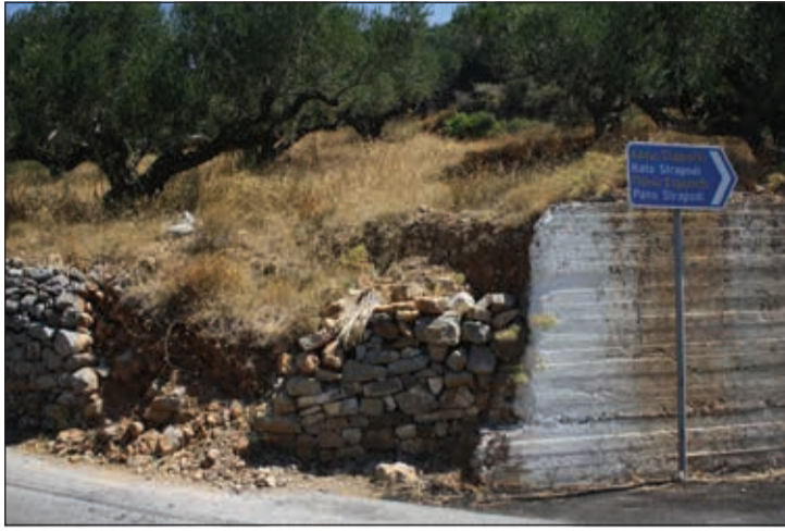
Αριστερά μία «χαλάστρα» πολύ κοντά στη θέση του ατυχήματος. Δεξιά, στον κεντρικό δρόμο ο τοίχος εγκυμονεί μία νέα χαλάστρα.

έκλειναν, όταν έπεφταν οι τοίχοι και άντε να βρεις τους ιδιοκτήτες να πηρήσουν όσα λέει ο δρόμος. Από την