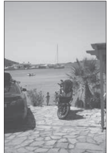
Η μοτοσυκλέτα «κρατά θέση» για κάποιον τυχερό ή προνοητικό!

επιτάσσουν τα σήματα της τροχαίας. Άρα επικράτησε η ...αυτοδικία και έκανε ο καθένας τον τροχονόμο και ό,τι του κατέβαινε στο κεφάλι. Φυσικά σε πολλές περιπτώσεις την ευθύνη την είχε ο Δήμος, που άφηνε ανενόχλητους όσους έκαναν τα παραπάνω. Θα πείτε δεν έχει Δημοτική Αστυνομία, την άλλη Αστυνομία δεν την βλέπαμε συχνά ή μάλλον καθόλου, οπότε βράστε τα. Γιατί ωραίες είναι οι γλάστρες, αλλά η τοποθέτησή τους εκεί που θέλει ο καθένας αποτελεί μία μορφή αυτοδι-