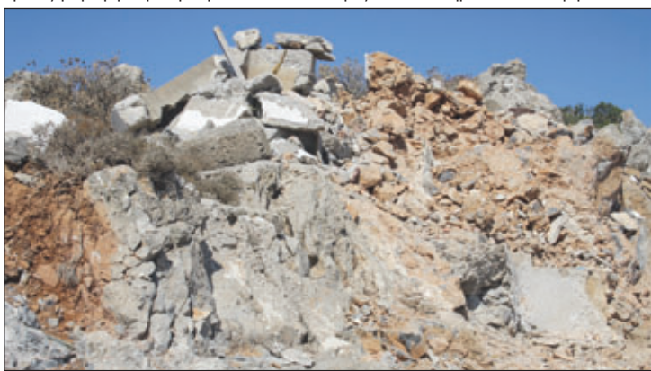
Μετά από μέρες εντατικής εργασίας τα συνεργεία της ΜΟΜΚΑ κατάφεραν και κατεδάφισαν το παλιό εικονοστάσι!

ΜΟΜΑ. Οι άνδρες της μονάδας θα φιλοξενούνταν για ένα περίπου μήνα από το Δήμο και ήρθαν φέρνοντας κάποια μηχανήματα. Μηχανήματα εντελώς ακατάλληλα για τέτοια έργα και προσωπικό ελάχιστα εξοικειωμένο για παρόμοια εργασία, ξεκίνησαν με το έργο της Αγίας Ελέσας, το οποίο δεν τελείωσαν, έφυγαν για το καλοκαίρι και θα επανέλθουν, λένε, το μήνα αυτόν, αφού κάθισαν 58 μέρες, δηλαδή διπλάσιο χρόνο από τον καθορισθέντα και χωρίς να ολοκληρώσουν το έργο. Μάλι-