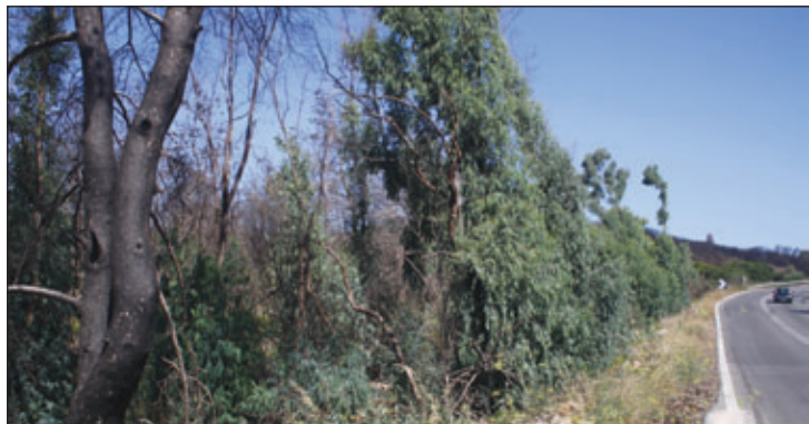
Ο κεντρικός δρόμος στη θέση Κερα-ρήνη. Οι ευκαλύπτοι απέκτησαν ήδη το φύλλο τους. Δίπλα αριστερά, τα πεύκα από το όμορφο δασάκι είναι κάθονο και μένουν εκεί περιμένοντας την κοπή. Ασφαλώς ξέχασαν τις υποσχέσεις ότι τα καμένα θα κοπούν άμεσα!

τικού μηχανισμού! Φυσικά η φύση δεν μπορούσε να περιμένει τον κρατικό μηχανισμό της συμφοράς να πάρει μπροστά. Τα δένδρα έκαναν δειλά-δειλά την εμφάνισή τους και τώρα θα μπουν μέσα (όταν μπουν...) θα τα τσαλαπατήσουν και άντε μετά να γίνει φυσική αναγέννηση. Φυσικά