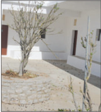
Δύο από τα δένδρα στο προαύλιο. Απλά τα έκαναν κούτσουρα! Στην άλλη φωτογραφία (από ανάρτηση στο facebook) τα κασίκια στα Κύθηρα ανενόχλητα επί το έργο.....

φωμένους χώρους και είχαν τοποθετηθεί μερικές δεκάδες γλάστρες με λουλούδια στον περίβολο και έξω α-