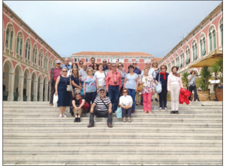
Εκδρομή στις Δαλματικές Ακτές πραγματοποιήσε με μεγάλη επιτυχία ο Κυθηραϊκός Συνδέσμος Αθηνών από 23-28/5/2018.