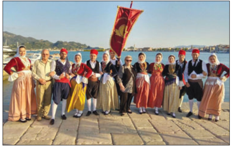
Το χορευτικό τμήμα του Κυθηραϊκού Συνδέσμου Αθηνών συμμετείχε με επιτυχία, για 4η φορά, στις εκδηλώσεις της Γκίστρας Ζακύνθου (25-28/5/2018).