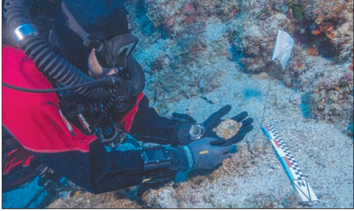
Η στιγμή της ανακάλυψης του σπίνιου αντιχειμώνα, το οποίο ερευνάται αν σχετίζεται με το γνωστό μηχανισμό, όπως εικάζουν οι αρχαιολόγοι. Δεξιά το χάλκινο αντικείμενο και η ακτινογραφία του που δείχνει το σχήμα βοοειδούς.

Τα ευρήματα από τις ανασκαφές στο βυθό των Αντικυθήρων παρου- ραρχίας 26, Πασαλιμάνι) και θα είναι ανοιχτή για το κοινό μέχρι 18 Μαρτί-