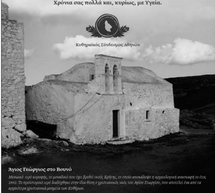
Άγιος Γεώργιος στο Βουνό

Μινιακό τερό κορυφής, το μοναδικό που έχει βρεθεί εκτός Κρήτης, το οποίο αποκάλυψε η αρχαιολογική ανασκαφή το έτος 1992. Το προϊστορικό τερό διαδόχθηκε στην ίδια θέση ο χριστιανικός ναός του Αγίου Γεωργίου, που αποτελεί ένα από τα αρχαιότερα χριστιανικά μνημεία των Κυθίων.