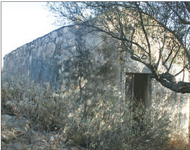
από σελ. 9

Παναγίας Οδηγήτριας έχει κτισθεί, όπως αναφέρει σε άρθρο της η Ελένη Χάρου-Κορωναίου, στο δεύτερο μισό του 16ου αι. από τον μοναχό Ιωακείμ Λουράντο, ο οποίος ήταν ο κτήτωρ και του ναού του Αγίου Γεωργίου στα Λουραντιάνικα. Και αναφέρουμε απλά το γεγονός με ό,τι μπορεί να σημαίνει η ανέγερση ενός νέου ναού αφιερωμένου και αυ-