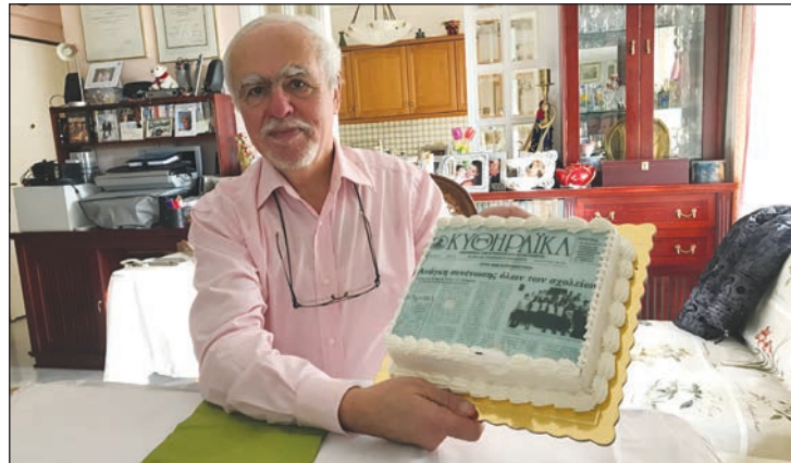
Το πρώτο φύλλο των "Κ" σε ...τούρτα!

βάζετε και ειδικά οι φανατικοί αναγνώστες που «ξεκοκαλίζουν» το φύλλο κάθε μήνα και προσέχουν ακόμη και τις διαφημίσεις! Το πρώτο μας φύλλο είχε για κύριο θέμα