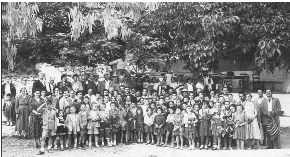
Μία πολυπρόσωπη φωτογραφία από τον Αμιραλή στον Καραβά με τους μαθητές του Δημοτικού Σχολείου στο Λειβάδι, πολλοί από τους οποίους συνοδεύονται από τους γονείς τους. Ασφαλώς δύσκολα ξεχωρίζουν τα πρόσωπα, παρά ταύτα δεν θα είναι λίγοι όσοι αναγνωρίσουν εδώ τις φατσούλες τους στα μαθητικά χρόνια, αλλά και τις μορφές των γονιών τους, που είχαν εκδράμει μαζί με τα παιδιά τους στο μακρινό τότε, αλλά πάντα πανέμορφο, Καραβά.