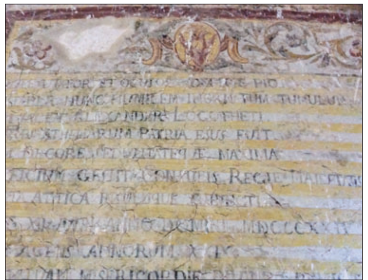
Η επιτύμβια επιγραφή στη Μυρτιδιώτισσα στο Κάστρο, στα Λατινικά και στα Ελληνικά.

Με την Επανάσταση μεγάλο μέρος από την τεράστια περιουσία της οικογένειας χάθηκε. Το αρχοντικό τους στην οδό Άρεως, κοντά στο Μοναστηράκι απέναντι από τη βιβλιοθήκη του Αδριανού γεμάτο με αρχαιότητες, στο οποίο φιλοξενήθηκε ο Έλγιν και από το οποίο πέρασαν προσωπικότητες της εποχής και γνώρισε μεγάλες δόξες, και κοσμική λάμψη, κατεστράφη και σώθηκε μόνο το οικογενειακό παρεκκλήσιο, ο άγιος Ελισαίος, όπου λειτουργούσε ο παπα Πλανάς και εκ-