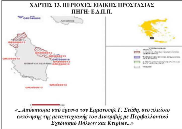
«...Απόσπασμα από έρευνα του Εμμανουήλ Γ. Στάθη, στο πλαίσιο εκπόνησης της μεταπτυχιακής του Διατριβής με Περιβαλλοντικό Σχεδιασμό Πόλεων και Κτιρίων...»

στην εφαρμογή του νόμου και, ως εκ τούτου, τα πράγματα δεν είναι το ίδιο αισιόδοξα.