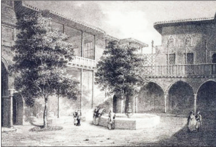
Το αρχοντικό της οικογένειας Λογοθέτη στην Αθήνα.

και υπό την Τουρκική κυριαρχία με το κύρος των προξενικών αξιωμά-