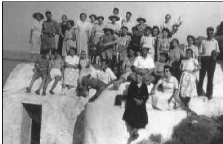
Μία ενδιαφέρουσα φωτογραφία του 1950. Νέοι και μεγάλοι δεκαπεντιστές από τα Μυρτιάδια φωτογραφίζονται πάνω στη στέγη του Αγίου Νικολάου του Κρασά σε μία κοντινή εξόρμηση από το Μοναστήρι, στο οποίο δεκαπεντίζαν.