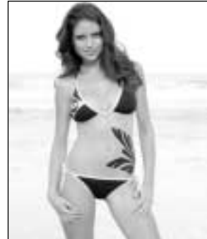
Πουό από τα δύο ...σκιάζαρα είναι πλέον κατάλληλο;

Μόλις πήγε σπίτι, κόβει μισό χαπάκι βιάγκρα και το δια-