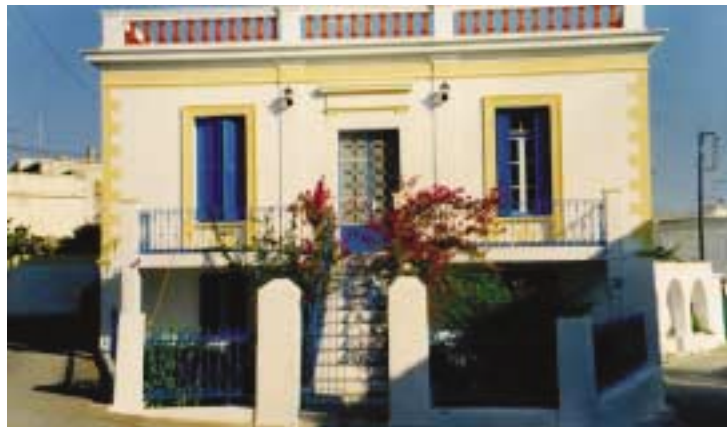
Αυτό το Κυθηραϊκό σπίτι πληρώνει «χαράτσι» παρόμοιο με αντίστοιχο στο ...Μαρούσι. Πότε θα διορθωθεί το «λάθος»;

ασήμαντο) δεν εισπράχθηκε ποτέ, ακόμη και μετά την ενοποίηση σε ένα Δήμο, καθώς φαίνεται ο Δήμος ήταν πολύ πλούσιος και δεν μπήκε στον κόπο να εισπράττει