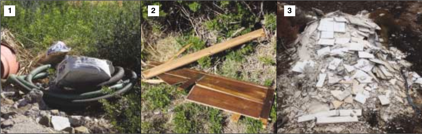
1. Ακριβώς απέναντι από τα μαγαζιά στην είσοδο από Βόρεια στο Λειβάδι! 2. Τα έπιπλα στο δρόμο στον Κουμάρο. 3. Μόλις λίγες μέρες μετά τη φωτιά στα Μαδερά, νέο φορτίο άρτι παραληφθέν! 4. Δρόμος στο Στραπόδι στρωμένος με σπασμένα είδη υγιεινής. Ότι πρέπει για τα λάστιχα!

Πόσα γράφουμε για τα σκουπίδια εδώ και χρόνια; Ούτε που θυμόμαστε. Μυαλό όμως δεν πρόκειται να βάλουμε ποτέ. Έπειτα μας φταίνει οι κυβερνήσεις, οι Δήμοι, οι ...εξωγήινοι και Κύριος Οίδε ποίοι ακόμα. Από μία πρόσφατη περιήγησή μας σε μερικά σημεία στο