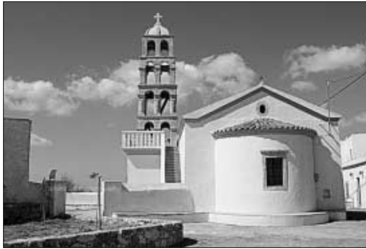
Ο ναός του Αγ. Σπυρίδωνος όπως είναι σήμερα

..... Από τα 15 θύματα του Λαγωνάρη στις Καλοκαιρινές μάς είναι γνω-