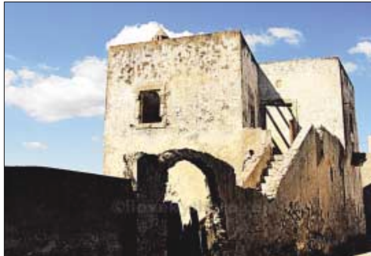
Κάτω από αυτό το σπίτι ξεκίνησε το φονικό.