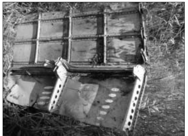
Κοντινή άποψη του κομματιού στα Καλησπεριάνικα.