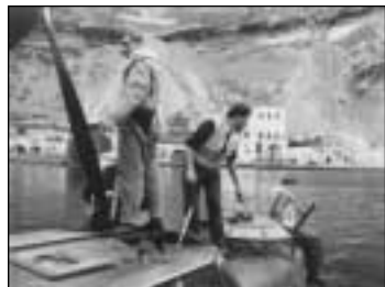
Το αεροσκάφος σε ταξίδι τροφοδοσίας μονάδας στην Σαντορίνη (Θήρα), μέσα του 1943.

Η Γερμανική φρουρά έθαψε τους νεκρούς στο Κάστρο. Μεταπολεμικά ειδική μονάδα του Γερμανικού Στρατού μετέφερε τις σωρούς στην Γερμανία.