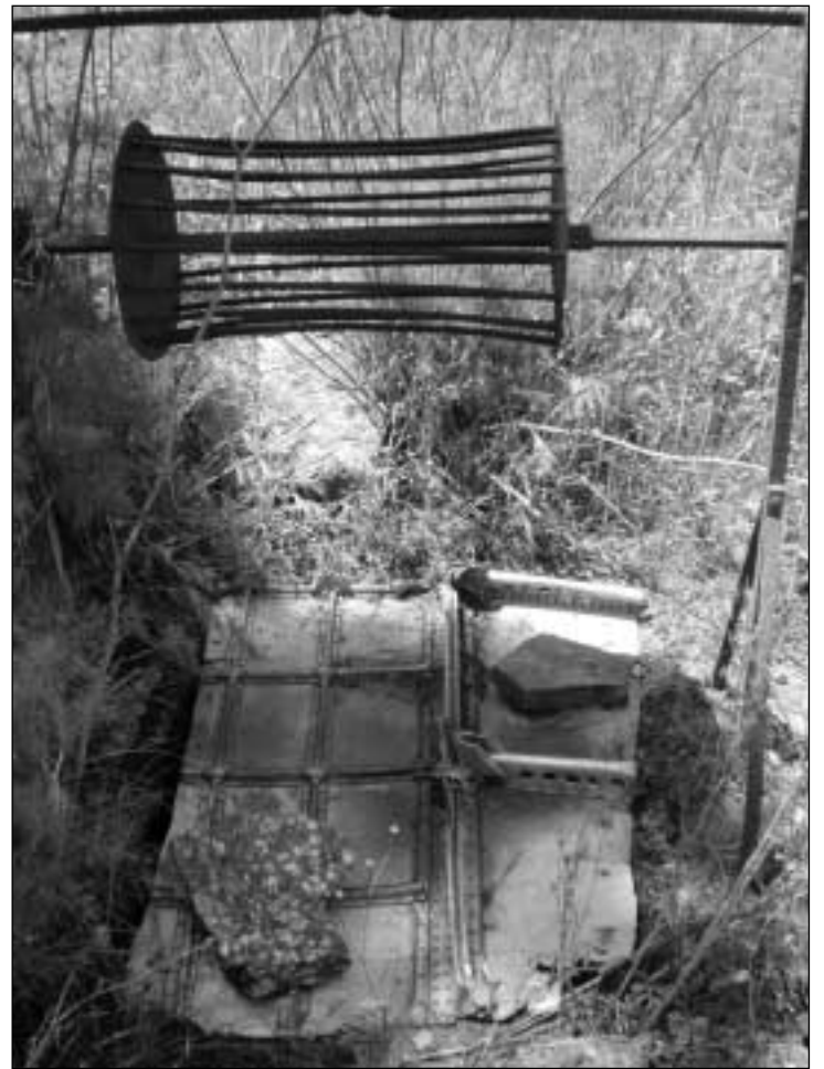
Πηγάδι και κάλυμμα

Το περιστατικό δεν ήταν το μόνο στο οποίο ενεπλάκη υδροπλάνο. Υπήρξε περιστατικό στον Αβλέμονα κατά το οποίο καίκι του ΕΛΑΝ (ναυτικό του ΕΛΑΣ): «...Στον Αβλέμονα ο ΕΛΑΝ κτύπησε και έριξε γερμανικό υδροπλάνο. Για το περιστατικό μάλιστα γράφτηκε και λαϊκό τραγούδι...» 6 . Το αεροσκάφος έπεσε στην Αγία Πε-