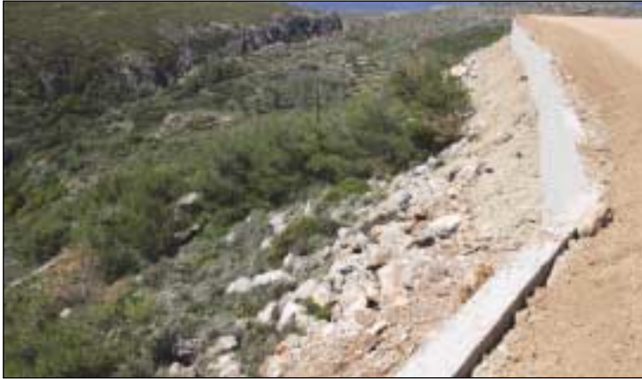
Το τοιχίο εδώ φαίνεται να είναι χαμηλότερο του οδοστρώματος και ασφαλώς, ή θα πρέπει να υψωθεί ή να τοποθετηθούν μπάρες.

λευταίο είναι ακριβές, όχι όμως για την αρχική ανάθεση. Στην πορεία του έργου και αφού είχε διαφανεί ότι δεν έφθανε το κονδύλιο, ζήτησε ο εργολάβος από το Δήμο συμπληρωματική χρηματοδότηση (περίπου δηλαδή το ζήτησε από τον...εαυτό του) και εκεί έγινε ένσταση από άλλο εργολάβο με αποτέλεσμα να καθυστερήσει πολύ καιρό. Πρόσφατα ο ενιστάμενος έχασε τη μάχη και ο Δήμος προχώρησε σε απ' ευθείας ανάθεση συμπληρωματικών εργασιών στον αρχικό ανάδοχο, συνολικού κόστους 56.000 ευρώ περίπου. Δεν έγινε γνωστό αν το ποσό αυτό αφορά εργασίες που είχαν εκτελεσθεί και δεν είχαν πληρωθεί ή άλλες που προβλέπονταν στην αρχική σύμβαση