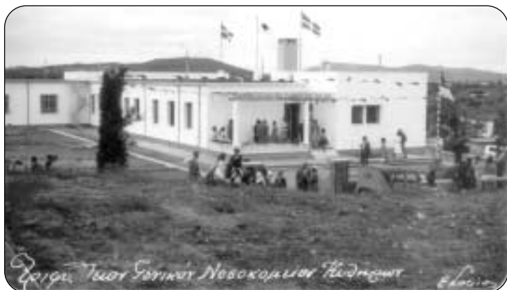
Το Τριφύλλιο Νοσοκομείο Κυθηρών νεόδμητο.

Και κάτι ακόμα, μην ελπίζεται ότι η σημερινή ηγεσία θα φροντίσει, χωρίς λαϊκή πίεση να λύσει τα προβλήματα του Νοσοκομείου μας και της περιθαλής μας. Δυστυχώς