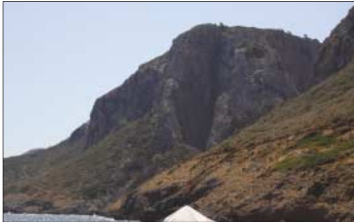
Ένα από τα δημοφιλή αναρριχητικά πεδία στην Κακή Λαγκάδα, όπως φαίνεται από την όμορφη ομώνυμη παραλία

και πρωτοβουλίες, καθώς θα μπορούσαν να προσθέσουν κάτι παραπάνω στην τουριστική κίνηση του τόπου. Τα «Κ» θα επιμείνουν στο θέμα και όποιος επιθυμεί μπορεί να προσθέσει στα λίγα αυτά στοιχεία του παρόντος σημειώματος.