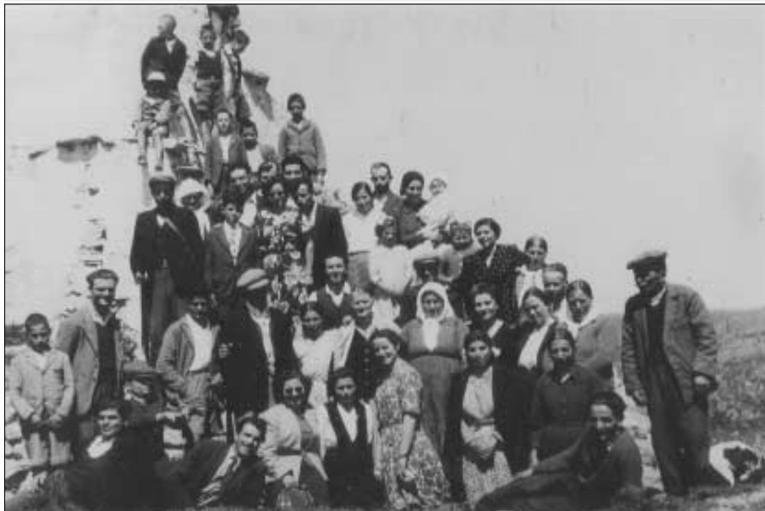
Μία ακόμη ενδιαφέρουσα παλαιά φωτογραφία. Μία μεγάλη ομάδα από πανηγυριώτες ποζάρουν μπροστά στο φακό σε ένα πανηγύρι στον Άγιο Ιωάννη το Θεολόγο στην ομώνυμη περιοχή πάνω από τη Φυρή Αμμο και την Κομπονάδα. Σίγουρα αρκετοί από τους νεώτερους στη φωτογραφία, που έχει ληφθεί το 1949, θα είναι εν ζωή και θα αναγνωρίσουν τους εαυτούς τους ή φίλους τους.