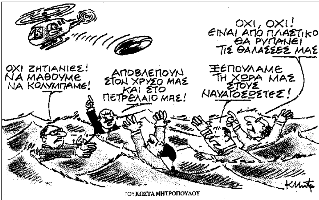
ΤΟΥ ΚΩΣΤΑ ΜΗΤΡΟΠΟΥΛΟΥ

ΘΑ ΘΥΜΑΣΤΕ ασφαλώς οι παλιοί πιστοί αναγνώστες μου όταν πριν μερικά χρόνια σας είχα γράψει για έναν καλό φίλο, ου έστειλε στον υπογράφοντα με κούριερ ραδίκια, που είχε μαζέψει στον Κάλαμο. Και αυτή η ιστορία είναι πολύ παλιά, ίσως και παλαιότερη από την προηγούμενη και έχει σχέση με τον Κάλαμο. Ένας καλός Καλαμίτης και κάποτε πρωτοκυνηγός και ψαράς συζητούσε με έναν άλλο κυνηγό και φίλο του από την Αίγινα, ο οποίος εκείνα τα χρόνια κατέβαινε κάθε Σεπτέμβρη στον Κάλαμο για τρυγόνια. Κουβέντα στην κουβέντα μία φορά του εκμυστηρεύτηκε ο Καλαμίτης πόσο πολύ του αρέσουν οι σάλπες. Είχε όμως να φάει χρόνια, γιατί δεν μπορούσε να πάει για ψάρεμα