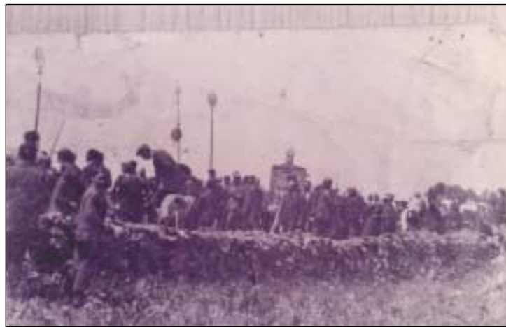
Μία παλαιότερη φωτογραφία από τη Γύρα της Παναγίας.

Λειβάδι(Κοντελετού)-Κούτσακας-Αλεξανδράδες-Σταθιάνικα-Φράτσια-Βιαράδικα-Μητάτα-Καστρισιάνικα-Τριφυλλιάνικα-Ποταμός-Λογοθετιάνικα-Αρέοι-Μυλοπόταμο-