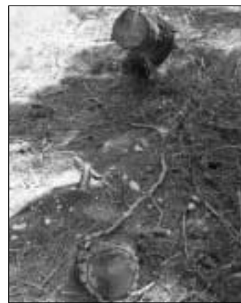
Δύο φωτογραφίες από τις κοπές στο δασύλλιο στον κεντρικό δρόμο. Αριστερά πρόσφατη κοπή. Δεξιά παλαιές κοπές.