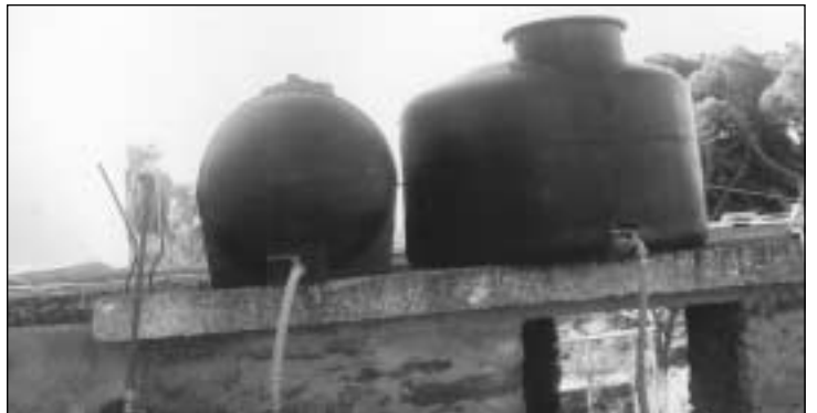
Στο Πετρούνη έβαλαν βυτία στις στέγες και τα γεμίζουν για ώρα ανάγκης, όπως το Πάσχα που είπαν το νερό, νεράκι. Χρόνια λέγαμε να βγει πολεοδομική διάταξη και να μην γίνονται σπίτια χωρίς δεξαμενές. Τώρα φαίνεται η αξία τους.

καιολόγητες διαγραφές χρεών, τις οποίες πάλι ο κόσμος χρεώνει σε προεκλογικές κινήσεις. Το κακό είναι ότι δεν υπάρχει πολύς χρόνος και το ΔΣ πρέπει να συζητήσει και να λάβει άμεσα αποφάσεις πάνω στο θέμα πριν αρχίσουν τα «τραγούδια», τα οποία φέτος ίσως είναι και πολλά και με μεγάλη ένταση! Εννοείται ότι οι αρχές πρέπει να λάβουν μέτρα και να θέσουν πλαίσια, αλλά και οι πολίτες να πειθαρχήσουν και να βοηθήσουν τη κατάσταση.