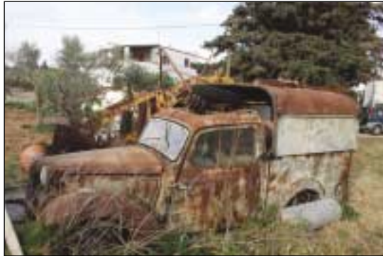
Το παλιό ΩΣΤΕΝ, όπως είναι σήμερα εγκαταλελειμμένο σε ένα χωράφι, θυμίζει κάποιες άλλες εποχές.

στο Λειβάδι οι αδελφοί Μανώλης και Χαράλαμπος Π. Φατσέα . Τα δύο αδέλφια βρήκαν στο κινηματοθέατρο Παλλάς της Βουκουρεστίου στην Αθήνα μία προπολεμική μηχανή δοκιμής ταινιών PYRENE αγγλικής προέλευσης, την οποία είχαν αγοράσει από τον αγγλικό στρατό και το 1952 την αγόρασαν έναντι 150 χρυσών λιρών Αγγλίας ( τότε, 1 λίρα=150δρχ). Οι πρώτες ταινίες το χειμώνα παιχτήκαν στη μεγάλη αί-