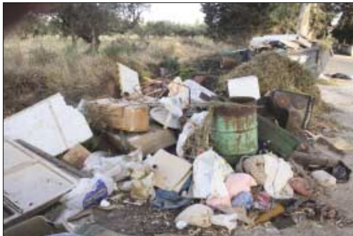
Φωτογραφία από το ίδιο μέρος, με τα ίδια σκουπίδια...εμπλουτισμένα με πολλά άλλα. Ανάλογη είχαμε δημοσιεύσει στο προηγούμενο και είναι από το παλιό γήπεδο στο Λειβάδι

ΠΩΛΕΙΤΑΙ οικοδομήσιμο οικόπεδο στο Κατούνι, 252 τμ με ασκεπές κτίσμα 67 τμ. Τηλ. 6977 320 836