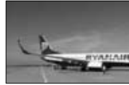
Η Κάλυμνος λόγω ότι έχει διεθνές αεροδρόμιο, απέκτησε και 5 άστερα ξενοδοχεία.

νατόν να μην αντιλαμβάνεται ότι τα λεφτά αυτά μάλλον θα πάνε τζάμπα!