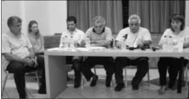
Τα μέλη του Δ.Σ. του Συνεταιρισμού, η εκπρόσωπος της Περιφέρειας και κτηνοτρόφοι.

Να σημειωθεί ότι στην εκδήλωση παρέστη και κράτησε σημειώσεις από τις τοποθετήσεις η αρμόδια διευθύ-