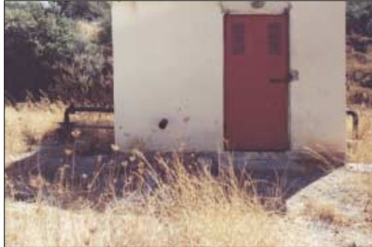
Οι γεωτρήσεις απαιτούν συνεχή συντήρηση. Εδώ αυτή της Καζημέλλισας.