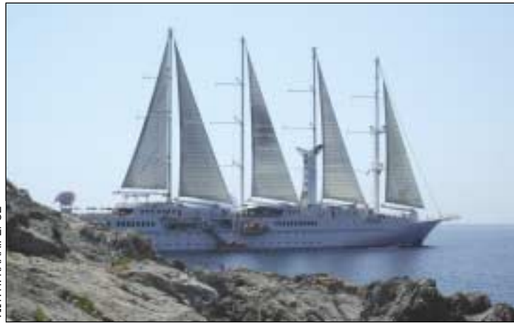
ΦΩΤ. Π. ΚΑΛΙΓΕΡΟΣ

θνικής οικονομίας, είδαν ότι άλλες χώρες (Τουρκία, Κροατία) άδραξαν την ευκαιρία και μας πήραν τη μουσική από το στόμα και άλλαξαν το στρεβλό και ασύμφορο νομικό