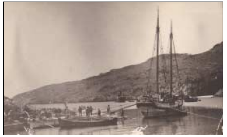
Φωτ. του Καψαλιού το 1920 με δύο δικάταρτα καΐκια. Το ένα ξεφορτώνει εμπορεύματα, μάλλον τρόφιμα από τον Πειραιά. Στο βάθος διακρίνεται μικρό ατμόπλοιο.

Δεν θα υπεισέλθουμε στην παράθεση και ανάλυση δρομολογίων του 20ου αιώνα καθώς νομίζουμε πως αυ-