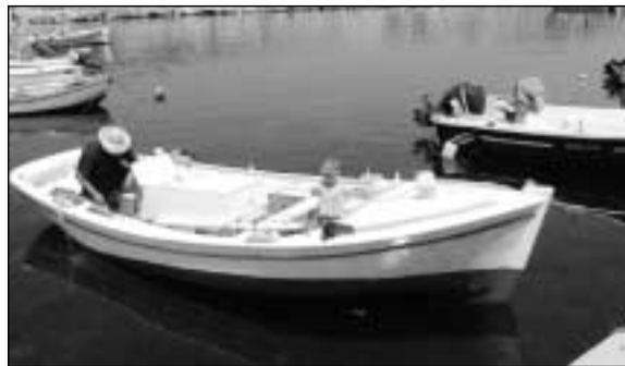
Την τράτα λέν ΠΟΡΔΙΤΣΑ, τη σκούνα ΤΣΙΡΙΓΩΤΗ, ΠΟΥΤ..... τη μαούνα, τη θάρκα ΒΑΡΒΙΤΣΙΩΤΗ!