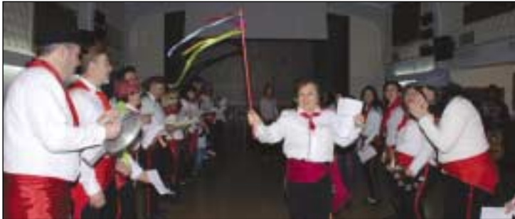
Η Μπάντα Καρικατούρα