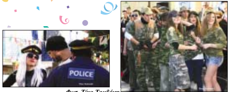
Φωτ. Τίνα Ταμβάκη