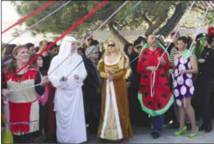
Από το Καρναβάλι στον Ποταμό