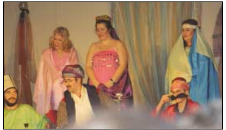
Βεζύρης (Σουλειμάκρας, Κουκούλ Πασάς, Κουτσούν Αγάς κ.α.)