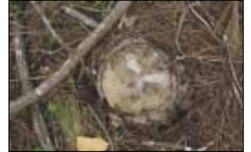
Τα σημάδια του εγκλήματος από παλαιές και νέες κοπές. Ούτε μία αναφορά στις αρχές ή ενδιαφέρον από αυτούς που έπρεπε να είναι θεματοφύλακες του τόπου!

δένδρα επί τόπου. Θα θυμάστε ασφαλώς για τους επαίνους που κάναμε για μία γυναίκα από τα Πιτσινιάνικα, η οποία φύτεψε και περιποιείται πολλά δένδρα λίγο έξω από το χωριό (την ίδια ώρα που μέσα σ' αυτό προτιμούν να κόβουν τα άρρωστα πεύκα αντί να ρίχνουν λίγο φάρμακο για να τα σώσουν). Τώρα, μία ομάδα από άγνωστους κακοήθεις προέβη στη λαθροουλοτομία στο Μαραθέα, αλλά και στην ανήκουστη πράξη καταστροφής δίπλα. Το παράδοξο είναι ότι, για να κόψει κανείς τόσα δένδρα και να τα μεταφέρει χρειαζόταν χρόνο. Άραγε κανείς δεν αντιλήφθηκε τίποτα; Κανείς δεν είδε τι έγινε; Και όλοι αυτοί,