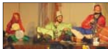
Σουλειμάκρας και Κουκούλ Πασάς!

ΠΩΛΕΙΤΑΙ επιχείρηση Σνακ-Μπαρ, Ουζερί στην Αγία Πελαγία. Τηλ. 6944 648519