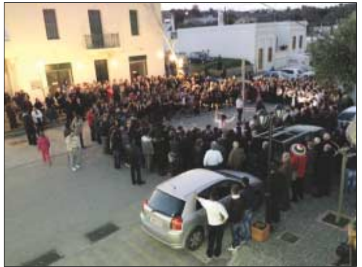
Το Γαϊτανάκι στο Λειβάδι