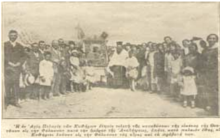
Μια αξιοσημείωτη προσφορά ομογενοῦς στα 1931:

Πρόσφατα ενώ ερευνούσαμε αρχαικό υλικό φιλικό μας πρόσωπο, μη Κυθῆριος, μας παρέδωσε ορισμένα τεύχη παλαιού περιοδικού του μεσοπολέμου το οποίο αναφερόταν, εν μέρει, στα Κύθηρα. Το σημαντικό ήταν πως το περιοδικό είναι σχετικά άγνωστο αφού δεν καταφέραμε να εντοπίσουμε πιθανά αναφορά σε αυτό.