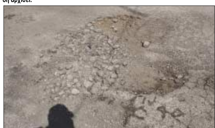
Ασφαλώς χρειάζονται μικροκονδύλια για επεμβάσεις σε έργα, όπως αυτό της φωτογραφίας, στο Λειβάδι. Εκείνο που δεν χρειάζεται είναι κατασκευές σαν κι αυτήν. Όπως φαίνεται στη φωτογραφία έρχοιαν λίγη άσφαλτο πρόχειρα και σε λίγο ο δρόμος έγινε ...χαντάκι, όπως πριν!

Το πρώτο που θα επισημάνουμε, για να καταλαβαίνει και ο πολίτης που βρίσκεται είναι ότι ο προϋπολογισμός, έτσι που συζητείται, δεν φωτίζει τους πολίτες, αφού ελάχιστοι από αυτούς παρακολουθούν τις σχετικές διαδικασίες και σ' αυτό ευθύνονται α-