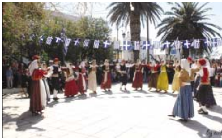
Μαθητές και μαθήτριες του Γυμνασίου και του Λυκείου στη Χώρα σε τοπικούς χορούς.